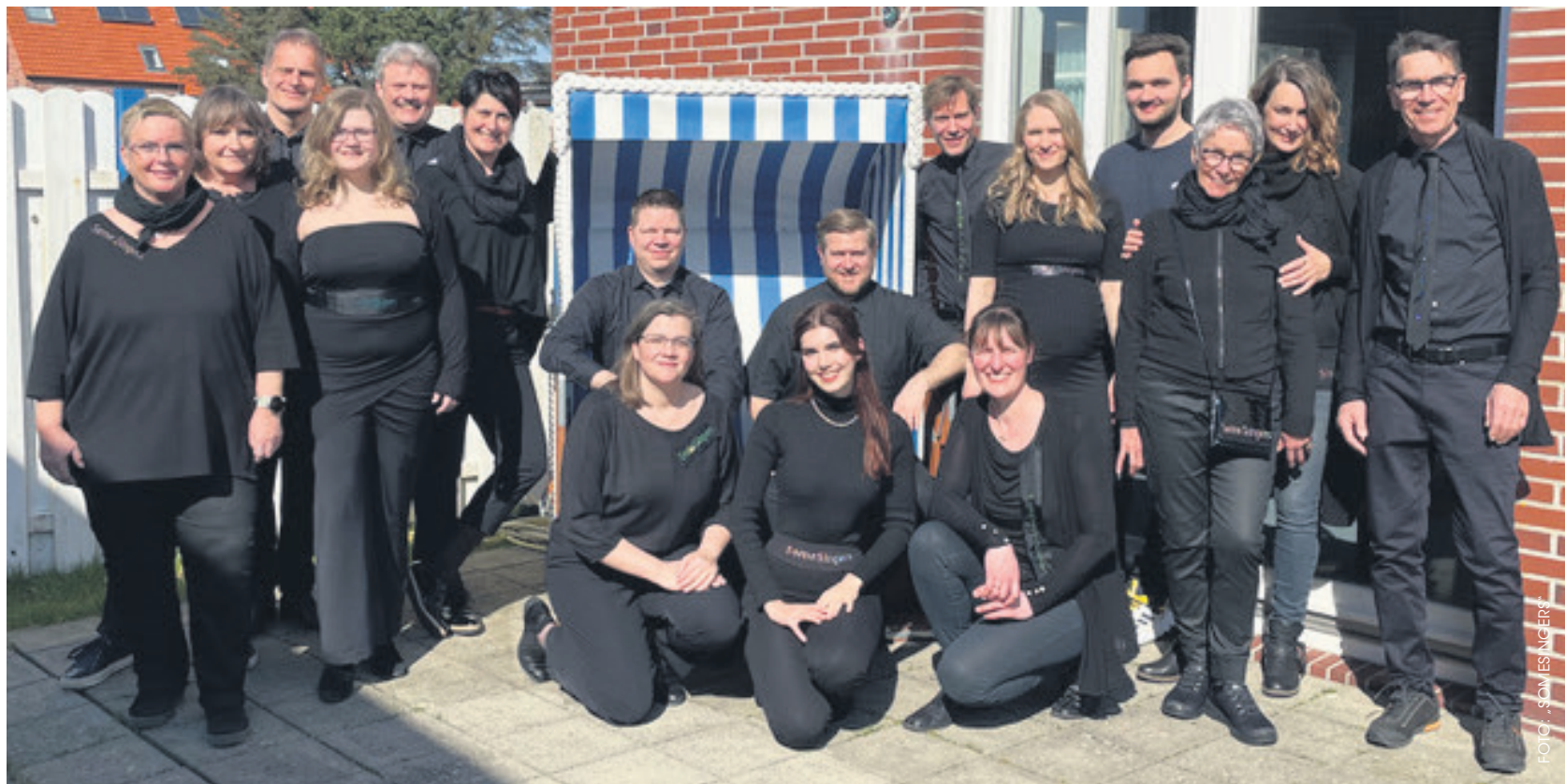
Freut sich auf die Präsentation des neuen Programms – der gemischte Chor „SomeSingers“.

MORGEN Überwiegend dicht bewölkt bei Temperaturen von 7 bis 11 Grad.