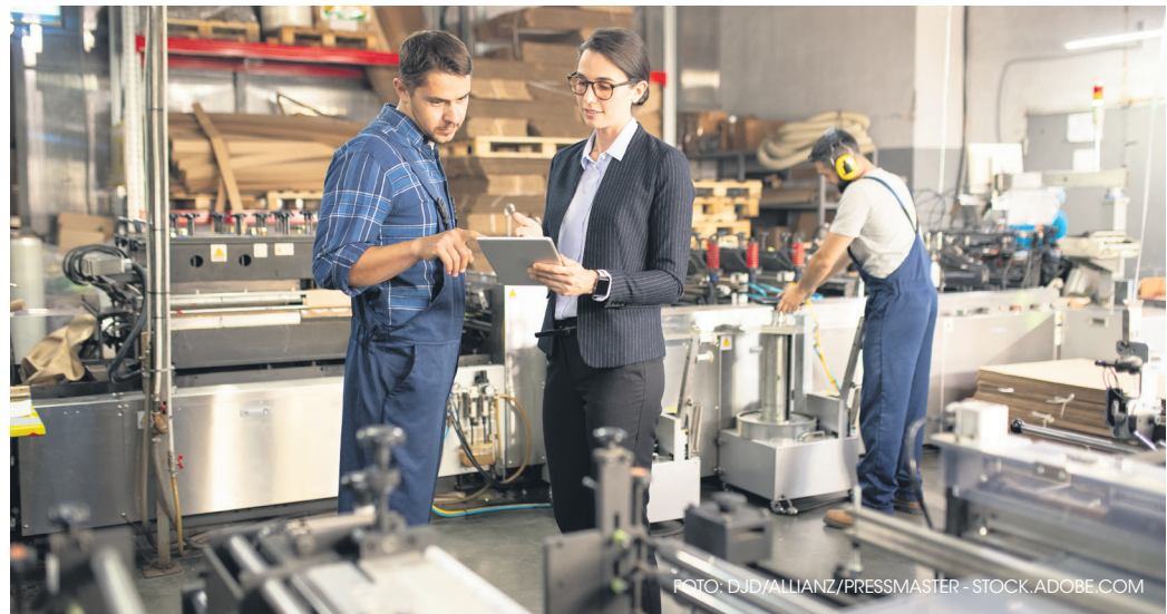
Immer mehr Firmen spüren die Auswirkungen des Fachkräftemangels. Eine Studie weist auf eine immer beliebtere Möglichkeit hin, um Fachleute zu binden.

finanziert. Darüber erhalten die Mitarbeitenden zusätzliche Gesundheitsleistungen, für die ihre gesetzliche Krankenversicherung (GKV) nicht oder nur teilweise aufkommt – etwa hochwertigen Zahnersatz, Behandlungen beim Heilpraktiker oder Zuschüsse für Brillen und Kontaktlinsen.