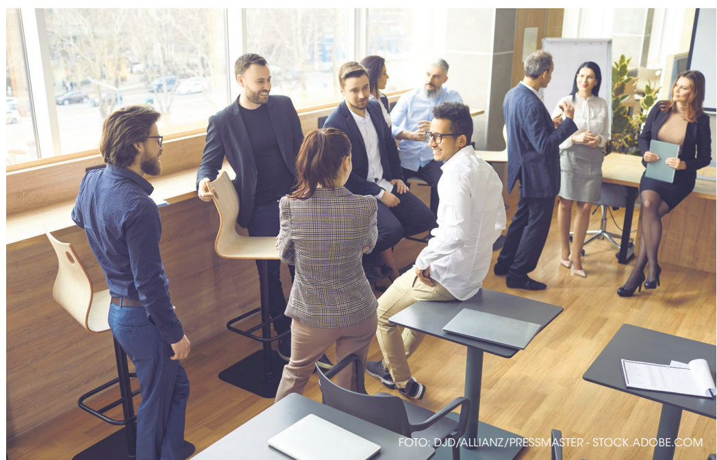
Mit einer vom Arbeitgeber finanzierten privaten Krankenversicherung können Unternehmen gut ausgebildete und motivierte junge Leute gewinnen und diese auch langfristig halten.