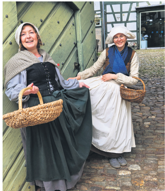
Idsteiner Gartenweiber

Die Tourist-Info ist unter Tel. 06126 78-620 zu erreichen oder per Mail unter tourist-info@idstein.de