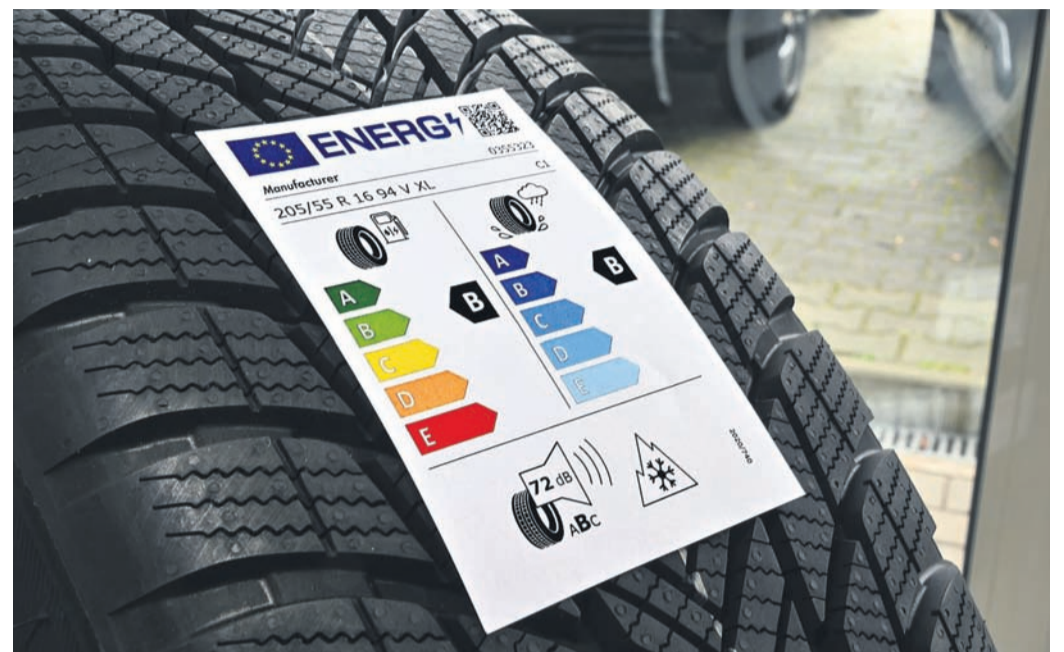
Das EU-Label enthält zahlreiche wichtige Informationen.

Um Umwelt und Verbrauch geht es in der Kategorie Kraftstoffeffizienz und Rollwiderstand. Mit Reifen, die bei diesem Kriterium in Klasse A eingestuft sind, hat ein Fahrzeug einen Verbrauchsvorteil