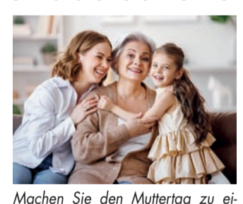
Machen Sie den Muttertag zu einem fröhlichen Familientag.

Der Muttertag ist ein Tag zu Ehren der Frauen. Das schönste Geschenk: Gesundheit. Die Daten zur Knochengesundheit zeigen: Circa 6,3 Millionen Menschen in Deutschland sind von einer Osteoporose betroffen; 82,5 % davon sind Frauen. 1 Nach heute wird diese chronische Knochenkrankung unterschätzt. 2 Warum ist das so?