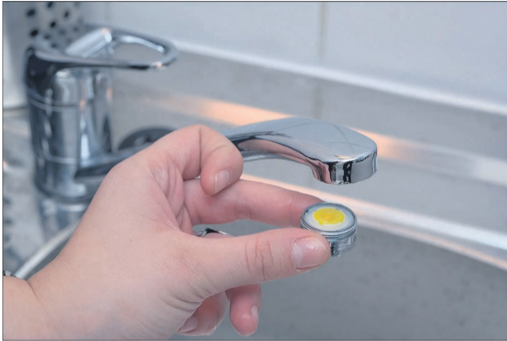
Wassersparende Armaturen senken den Wasserverbrauch, schonen den Geldbeutel sowie die Umwelt und das bei gleichbleibendem Wasserdruck.

Ein großer Teil des verbrauchten Wassers in Deutschland entfällt auf warmes Wasser: Durchschnittlich etwa jeder dritte Liter im Haushalt ist angenehm temperiert. Viel warmes Wasser zu verbrauchen, kann jedoch schnell teuer werden. Die gute Nachricht: Schon wer seine Gewohnheiten ein bisschen ändert, kann bares Geld einsparen. Gerade in älteren Häusern und Wohnungen besteht die Armatur am Waschbecken oder in der Dusche häufig noch aus zwei Wasserhähnen für je kaltes und warmes Wasser. Langfristig kann es sich lohnen, auf Einhebelmischer umzusteigen, so die Energieberatung der Verbraucherzentrale.