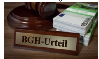
Starkes Urteil für Versicherte.

auch heute noch anfechtbar. Man nennt dies „ewiges Widerrufsrecht“. Bei einem Widerruf erhalten Sie – anders als bei der Kündigung – alle eingezahlten Beiträge ohne Abzug von Maklerprovisionen und Verwaltungskosten zurück. Und nicht nur das: Die Versicherung muss Ihnen eine sogenannte Nutzungsentschädigung dafür zahlen, dass Sie mit Ihrem Geld Gewinne erwirtschaftet hat. So können Sie im Idealfall bis zum Doppelten der eingezahlten Beiträge zurückerhalten. Ein sattes Plus auf Ihrem Konto winkt – in Zeiten hoher Inflation eine wirklich gute Nachricht!