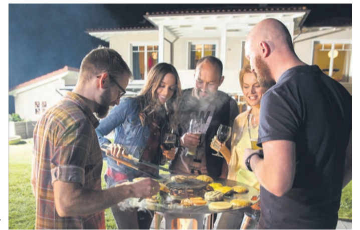
Holzpellets als Brennstoff können nicht nur zum Grillen genutzt werden, sondern liefern im klimaschonenden Terrassenheizer auch Wärme für kühle Abende.

brauch niedrig. Zudem entsteht nur sehr wenig Asche. Aber auch andere Entwicklungen für den Gartenbereich zeigen, wie vielfältig Pellets sind. Denn die kleinen Holzpresslinge eignen sich nicht nur gut zum Grillen, sondern funktionieren als klimaschonender Brennstoff auch in Heizstrahlern für die Terrasse.