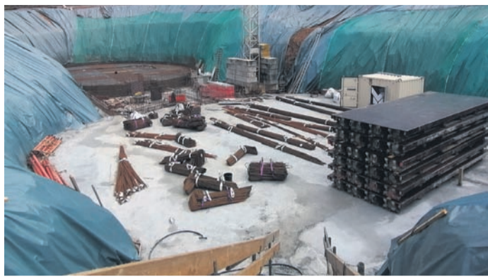
Der Bau des Trinkwasserhochbehälter in Wehen läuft nach Plan. Mehr als 8.000 Kubikmeter Erde ausgehoben.

Neuer Trinkwasserhochbehälter in Wehen nimmt Formen an