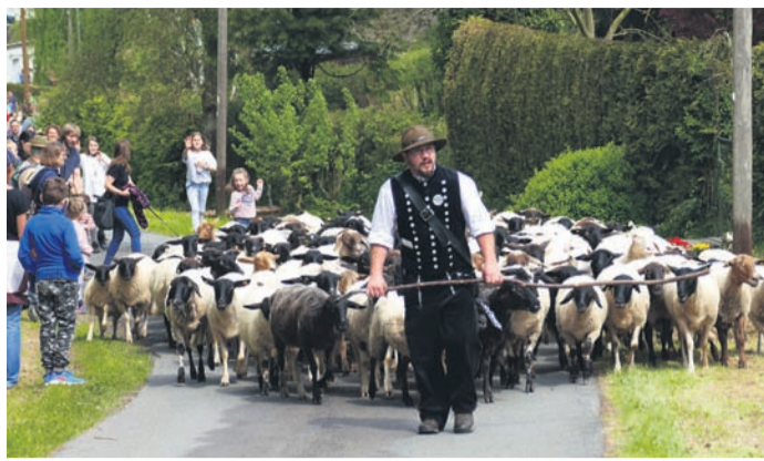
Nach langer Pause wird wieder mit dem Almauftrieb in Niederglabach die Weidesaison eröffnet.

Schafherde und Fest eröffnen die Weidesaison