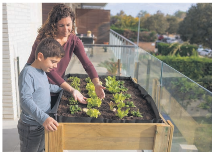
Ein Hochbeet bietet vielen Gemüsesorten ganzjährig optimale Wachstums- und Erntebedingungen.

Gemüsesorten ganzjährig optimale Wachstums- und Erntebedingungen. Besonders beliebt sind Hochbeete aus Holz, mit ihnen bleibt man im Gegensatz zu anderen Konstruktionen wie Stein oder Beton flexibel. "Hochbeete aus Holz sollten auf der Innenseite mit einer reißfesten Folie ausgekleidet werden, so kommt das Holz nicht in direkten Kontakt mit der feuchten Erde", rät Patrick Dillmann von Saatgut Dillmann. Im Frühjahr oder Herbst könne man zusätzlich um das Hochbeet herum eine Folie anbringen. Sie hält die Wärme im Beet, so kann man früher säen oder länger ernten.