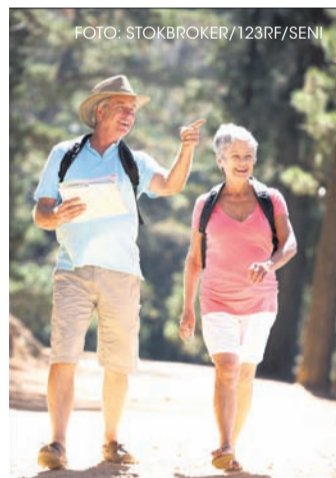
Bewegung fördert das Wohlbefinden und trägt zu einer gesunden Lebensweise bei.