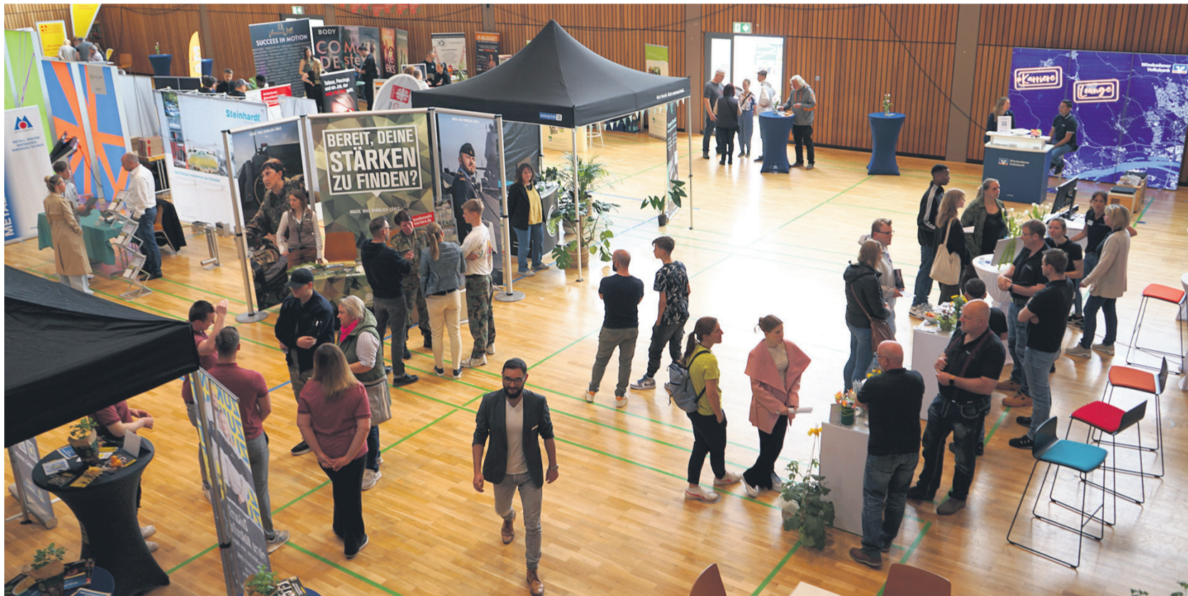
Rundum zufrieden zogen Aussteller und Veranstalter eine Positive Bilanz der Jobbörse „Taunus connect live“ in Taunusstein.

MORGEN Vereinzelt Wolken mit Temperaturen von 14 bis 23°C.