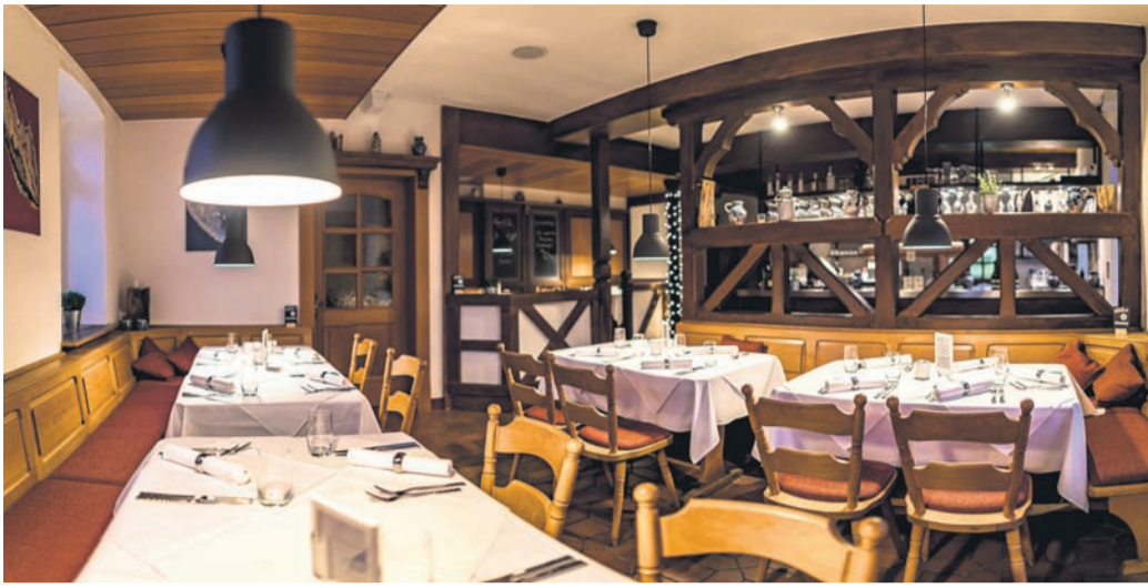
Nach Angaben des Inhabers hätte er für die Erneuerung der Einrichtung und Mobiliar noch 45.000 Euro beisteuern müssen.