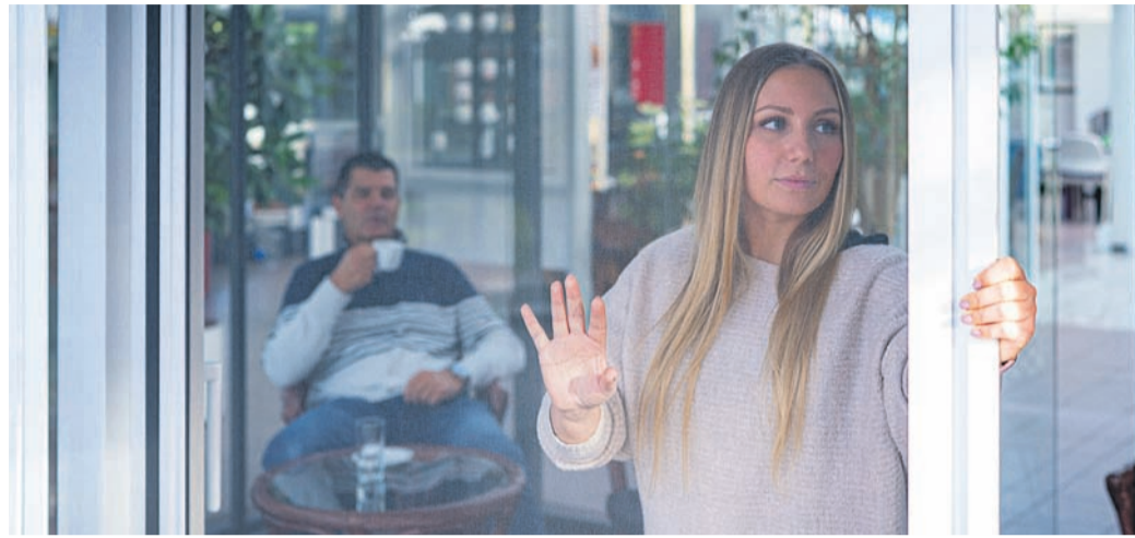
Insektenschutz nach Maß: Die Profis vom Rollladen- und Sonnenschutzbetrieb vor Ort fertigen individuell passende Spannrahmen an. Störenden Mücken, Wespen und Fliegen ist der Weg in die Wohnräume dann dauerhaft versperrt.

Nach Maß gefertigt und professionell montiert