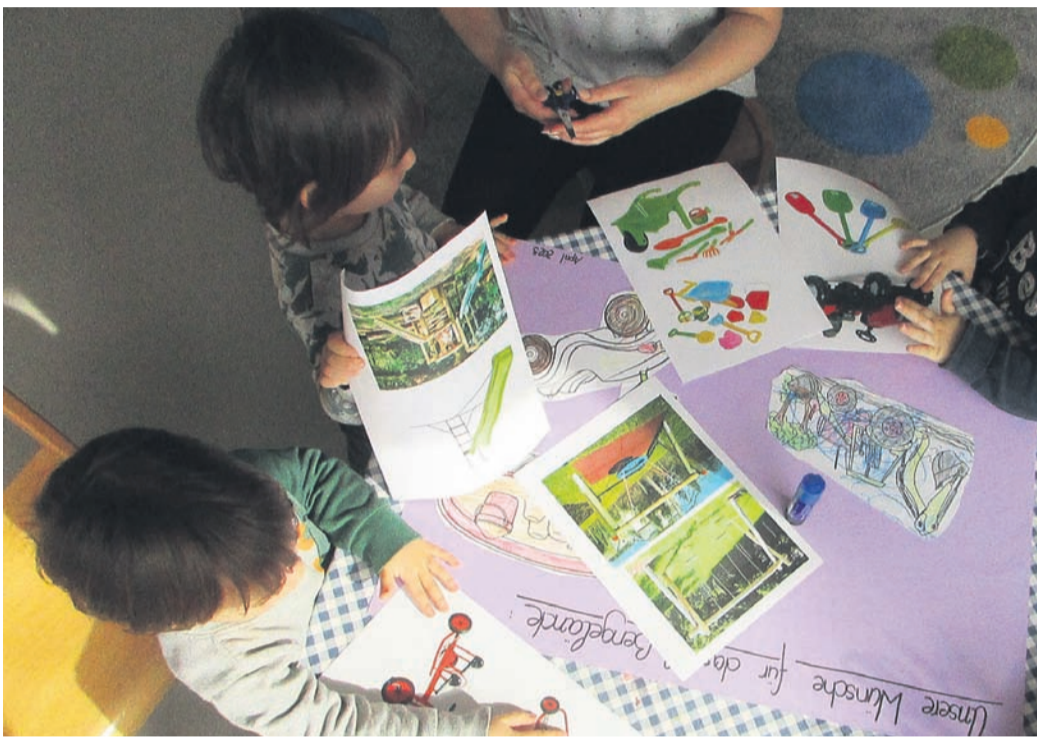
Die Kinder bei ihrer Planung.