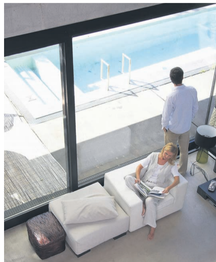
Rundum wohlfühlen: In Eigenheimen aus Beton herrscht das ganze Jahr über ein angenehmes Raumklima.

Das liegt auch an seiner Wärmespeicherfähigkeit: Überschüssige Wärme wird zwischengepuffert, bevor sie ins Innere des Gebäudes eindringen kann. Nachts, wenn sich die Luft im Normalfall abkühlt, wird die gespeicherte Wärme wieder an die Außenluft abgegeben. Durch dieses Wechselspiel bleiben die Wohnräume selbst im Hochsommer angenehm temperiert. Auf zusätzliche Maßnahmen wie eine Klimaanlage oder aufwendige Wärmedämmungen kann bei der Verwendung von Beton oft verzichtet werden. Das erleichtert die Bauarbeiten und spart sowohl Zeit als auch Ressourcen. Aber auch während der kalten Jahreszeit erweist sich