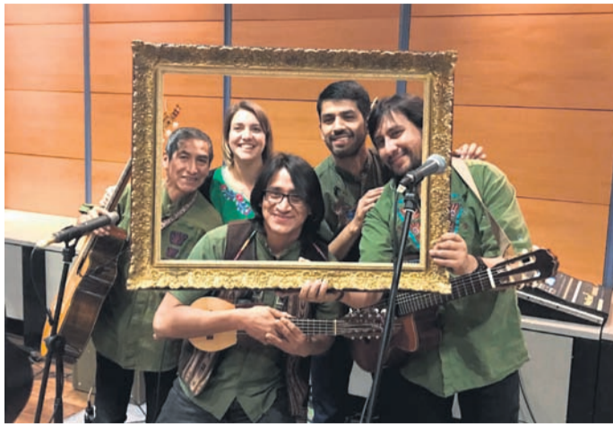
Die Formation Wiñay mit den typischen Instrumenten wie Kena, Zampoñas oder Bombo stammt aus Peru.

Den Doppelpack im flotten Dreier übernimmt die Fiesta Latina, ein Festival lateinamerikanischer Musik mit zwei