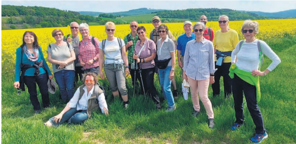
In seinem Jubiläumsjahr richtete der Turnverein Wehen die diesjährige Frühjahrswanderung des Turgau Mitteltaunus aus.