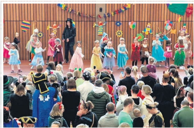
Der Wehner Kinderfasching verzeichnete in diesem Jahr einen Besucherrekord (über 800 Besucher).