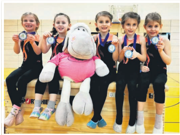
Auch der Turn-Nachwuchs des TV Wehen nahm dieses Jahr an mehreren Wettkämpfen teil.

die Geschichte folgt direkt aufgestellt und freut sich auf viele weitere erfolgreiche und vor allem „bewegte“ Momente, die in der Vereinschronik eingetragen werden können.