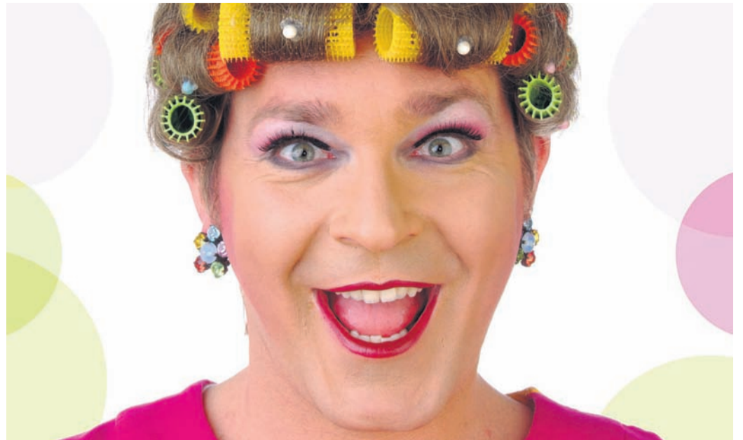
Lilli gastiert in Heidenrod-Springen.