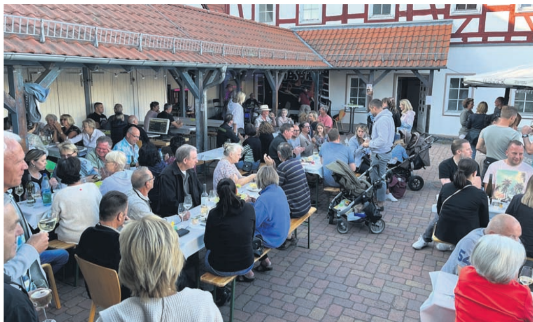
Trifft den Nerv der Zeit. Das Weinfest in Neuhof.