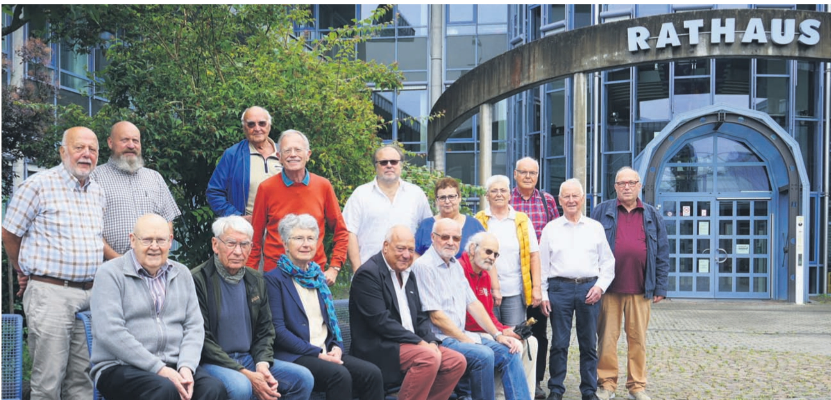
Mitglieder Seniorenbeirat 2023

Toller Festnachmittag im Bürgerhaus „Taunus“