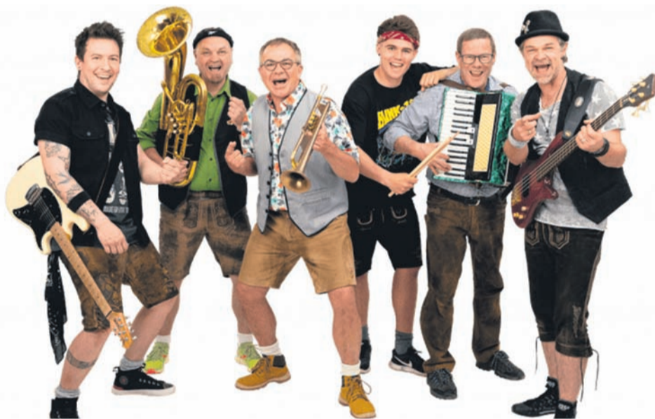
Partykracher in Hahn. „Die Grumis“.

Hits zum Mitschunkeln sowie Oldies, Classic Rock-Hits, Ballermann-Partykracher zum Mitmachen, aktuelle Chartbrecher und Gute-Laune-Medleys zum Tanzen. In Taunusstein sind die „Grumis“ bekannt vom 125. Jubiläum der freiwilligen Feuerwehr Hahn und der Hahner Kerb der vergangenen Jahre. Der Einlass ist ab 19 Uhr. Die Musik legt ab 20 Uhr los. Die Eintrittskarten kosten im Vorverkauf 15 Euro und an der Abendkasse 18 Euro. Der Vorverkauf hat bereits begonnen. Karten gibt es im Spielwaren- & Fahrradverkauf Schauss (Aarstr. 135 in Taunusstein) und im Anja Friedrich Modehaus (Mühlfeldstraße 20 in Taunusstein). In Zusammenarbeit mit dem Team „Gaumenschmaus“ bietet die Hahner Kerbegeellschaft neu auf ihrer Speisekarte „halbes Hähnchen mit Pommes“ für den bayrischen Abend an.