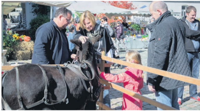
Immer etwas los beim Breithardter Eselsverein.

Im Jahre 1956 wurde eine weitere Kirche (katholisch) eingeweiht. Das jetzige Rat-