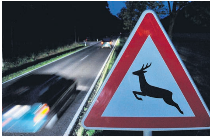
Im Herbst ist besondere Vorsicht geboten.

Aber natürlich gibt es auch Dinge, die man nach einem Wildunfall unbedingt tun sollte. Dazu gehören laut ACE folgende Punkte: - Trotz allem Ruhe bewahren, Warnblinker anschalten, Warnweste anlegen und Unfallstelle absichern. - Bei Verletzten im Auto die 112 wählen und Erste Hilfe leisten. - Die Polizei rufen; diese informiert dann den zuständigen Jäger oder die zuständige Jägerin. - Wildunfallbescheinigung von der Polizei ausstellen lassen; diese wird als Nachweis für die Versicherung benötigt. - Die Kfz-Versicherung kontaktieren, damit Schäden am Fahrzeug über die Teil- oder