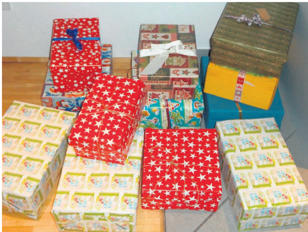
So sehen die perfekten Kartons aus für die Aktion „Weihnachten im Schuhkarton“.

Dann füllt man den Schuhkarton mit wertschätzenden Dingen, die praktisch sind und Freude bereiten, wie Hygieneartikel: Zahnbürste (org. verpackt), Zahnpasta, Waschlappen, kl. Handtuch, Kamm oder Bürste, Creme, Haarschmuck, Flüssigseife, Shampoo, Deo, Lippenbalsam. Spielsachen: Kuscheltier, Puppe, Auto, Ball, Jo-Jo, Murmeln, Mini-Puzzle, Springseil, Musikinstrument, Malkasten und Pinsel, Knete, Fußball mit Pumpe.