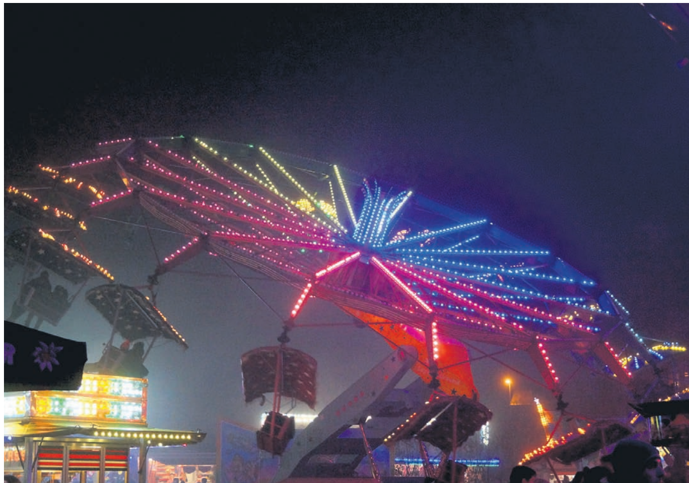
Rummel auf dem Schmidbergplatz.