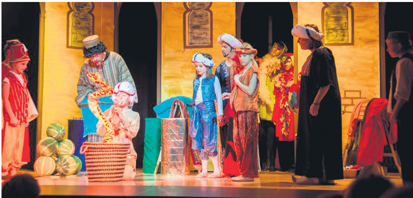
Bunte Farben dominieren bei dem Theaterstück Ali Baba und die 40 Räuber.

Theatergruppe Wundertüte e.V. präsentiert „Ali Baba und die 40 Räuber“.