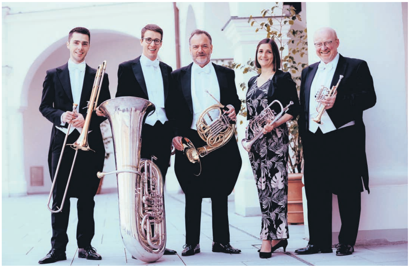
Zum 10. Mal in Idstein: Harmonic Brass.