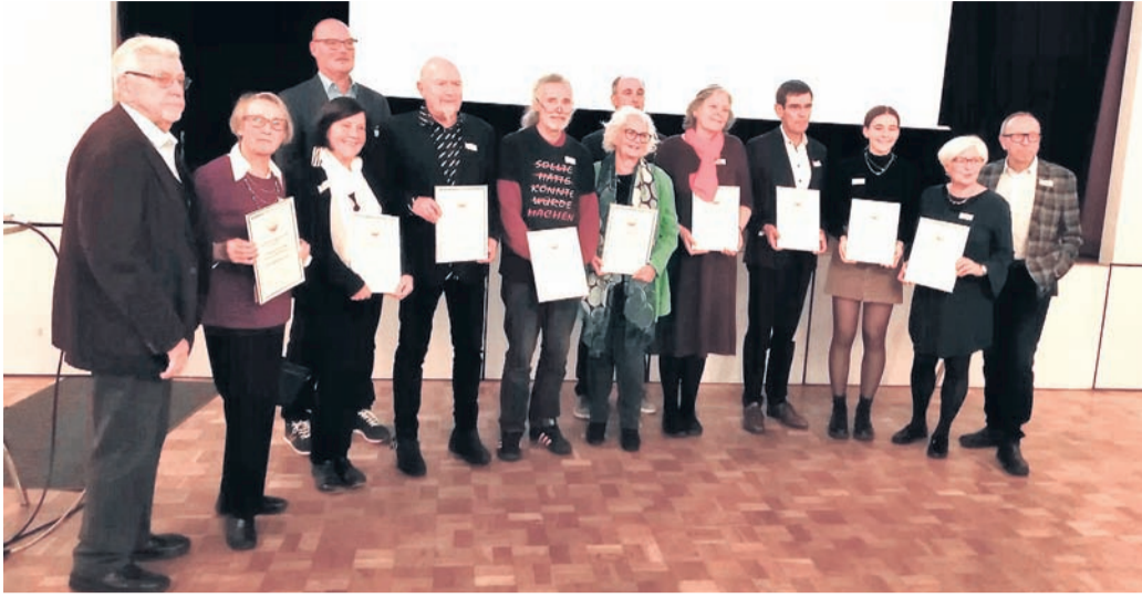
Die Preisträger auf einen Blick.