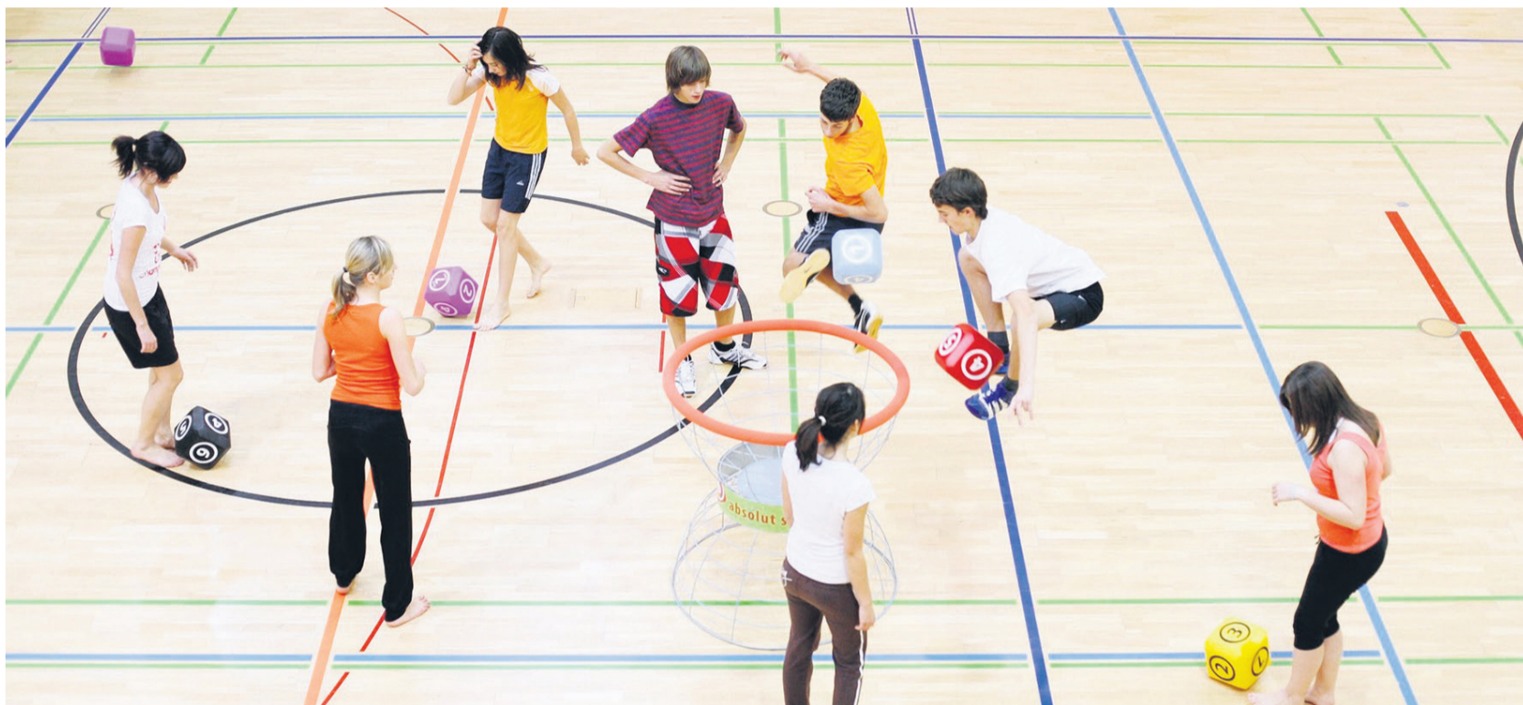
Vorläufig kein Sport in der Taubenberghalle.

Informationsveranstaltung am 14. November in der Stadthalle Idstein