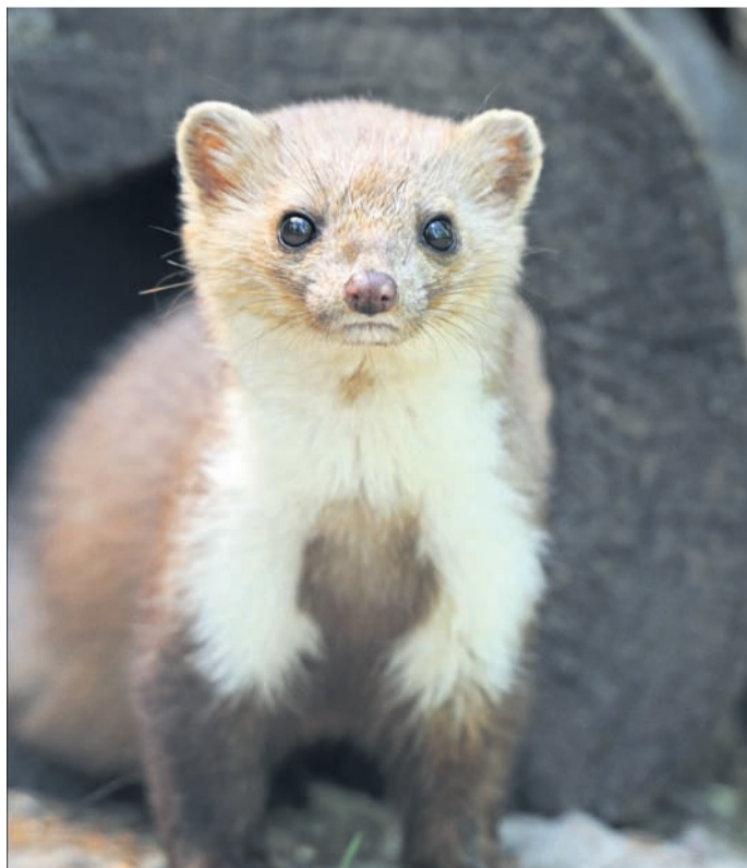
Um die nachtaktiven Nager dauerhaft fernzuhalten, eignen sich spezielle Ultraschallgeräte.

Das ist auch nicht notwendig, denn die schlaun Tierchen lassen sich vertreiben, wenn sie sich dauerhaft gestört fühlen - beispielsweise durch sehr hohe Töne, die für Menschen unhörbar sind. Damit sich die Tiere nicht an das Geräusch gewöhnen, sollten die Frequenzen permanent wechseln. Kleine Geräte senden variierende Ultraschallwellen aus und schaffen so für Marder ein permanent unerträgliches Umfeld. Dank des Batteriebetriebs können die kleinen Geräte an allen neuralgischen Stellen platziert werden - die lästigen Marder meiden den Bereich nach kurzer Zeit. Für Menschen und Haustiere wie Hunde, Katzen und Vögel sind die Ultraschalltöne unbedenklich.