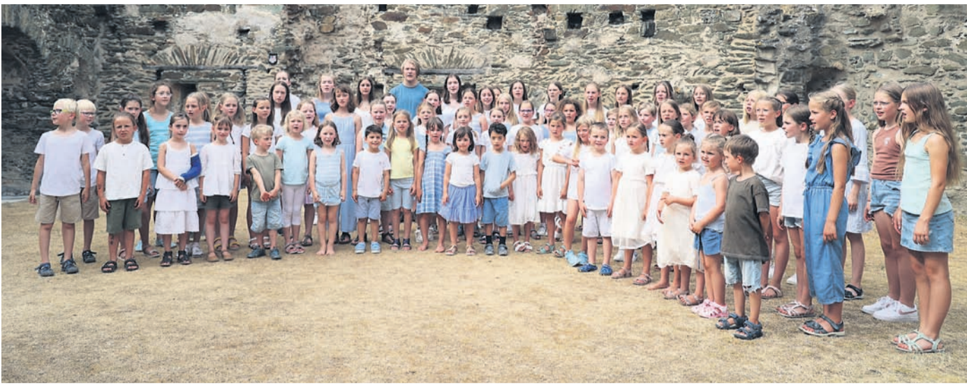
Der Jugendchor MiniMaxis nahm sein 13. Musikvideo auf.