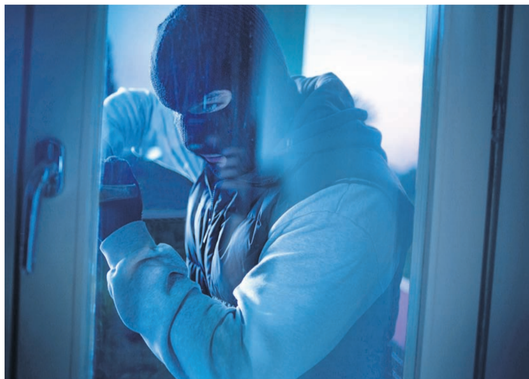
Im Vergleich zum Rest des Jahres passieren Einbrüche häufiger während der dunklen Jahreszeit. Am „Tag des Einbruchschutzes“ wird daran erinnert.