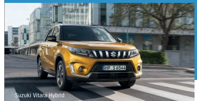
Suzuki Vitara Hybrid

Jetzt 250 EUR* sichern. Die Suzuki Probefahrtwochen.