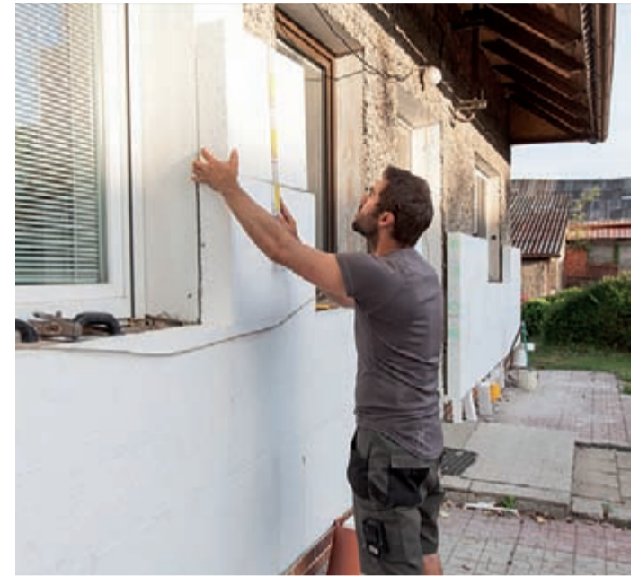
Welche Art der Fassadendämmung optimal ist, hängt von den individuellen Rahmenbedingungen ab.

Winter sind die Außenwände wärmer, im Sommer heizen sie sich weniger auf. Erfüllt der zusätzliche Wärmeschutz definierte Mindestanforderungen, winkt finanzielle Förderung durch den Staat: Zwanzig Prozent der Kosten können als Zuschuss gewährt werden. Wer Fragen zur Fassadendämmung hat, kann sich an die Beratungsstellen der Energieberatung der Verbraucherzentrale wenden, entweder online unter verbraucherzentrale-energieberatung.de oder telefonisch unter: (0800) 809802400. Dieser Service wird gefördert vom Bundesministerium für Wirtschaft und Energie.