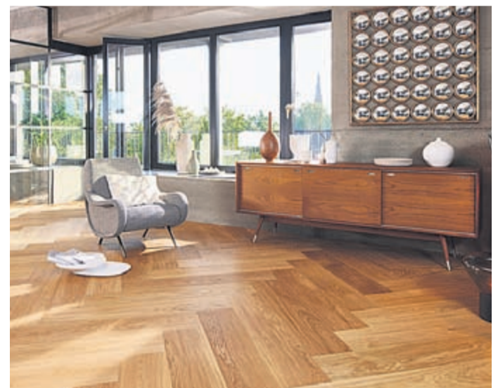
Fischgrät ist nach wie vor eine der beliebtesten Verlegearten.

Eine andere, ebenfalls ruhig und gleichmäßig wirkende Variante ist der Leiter- oder Parallelverband. Im Parallelverband werden die Holzstäbe auf gleicher Höhe nicht versetzt, sondern parallel zueinander verlegt. „Dies wirkt geometrisch und ordnend“, betont Holzexperte Schmid.