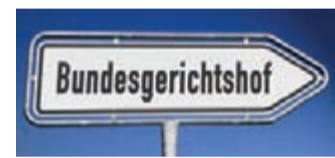
Starkes Urteil für Versicherte.

sind viele Versicherungsverträge auch heute noch anfechtbar. Man nennt dies „ewiges Widerrufsrecht“. Bei einem Widerruf erhalten Sie, anders als bei der Kündigung, alle eingezahlten Beiträge ohne Abzug von Maklerprovisionen und Verwaltungskosten zurück.