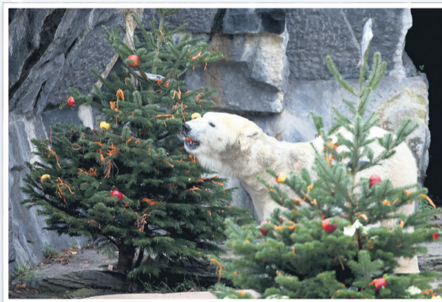
Manche Zoos freuen sich auch nach dem Fest noch über gespendete Weihnachtsbäume - als Spielzeug oder gar Futter für ihre Tiere.

Seen als Versteckmöglichkeit und Laichhilfe angeboten. Es kann sich lohnen, bei der eigenen Kommune nachzufragen, ob für solche Zwecke Bedarf besteht und die Weihnachtsbäume gezielt dafür abzugeben. Übrigens: Die reguläre Müllabfuhr nimmt die alten Bäume in der Regel nicht mit. Stattdessen gibt es meist bestimmte Termine für die Abholung. Diese stehen in der Regel im Abfallkalender, in den Lokalzeitungen oder in Online-Bekanntmachungen der Kommunen. Wer die Termine verpasst, sollte den alten Weihnachtsbaum zum Recyclinghof oder die Annahmestellen für Grünschnitt bringen.