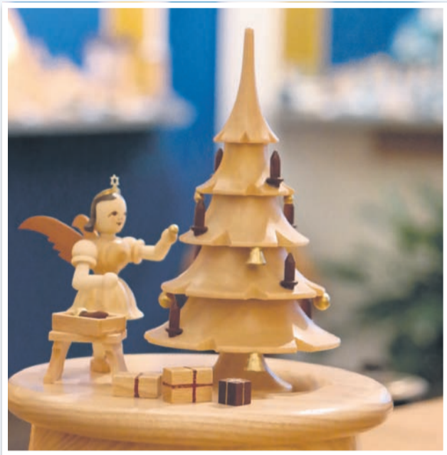
Wenn der liebevolle gestaltete Faltenrockengel sich auf der weihnachtlichen Spieldose dreht, spürt jeder, dass Musik die Sprache der Engel ist. Die hochwertigen Spieldosen aus dem Erzgebirge (hier eine Aufnahme aus den Werkstätten) sind beliebte Geschenke, die für viele Generationen jedes Weihnachtsfest verschönern.