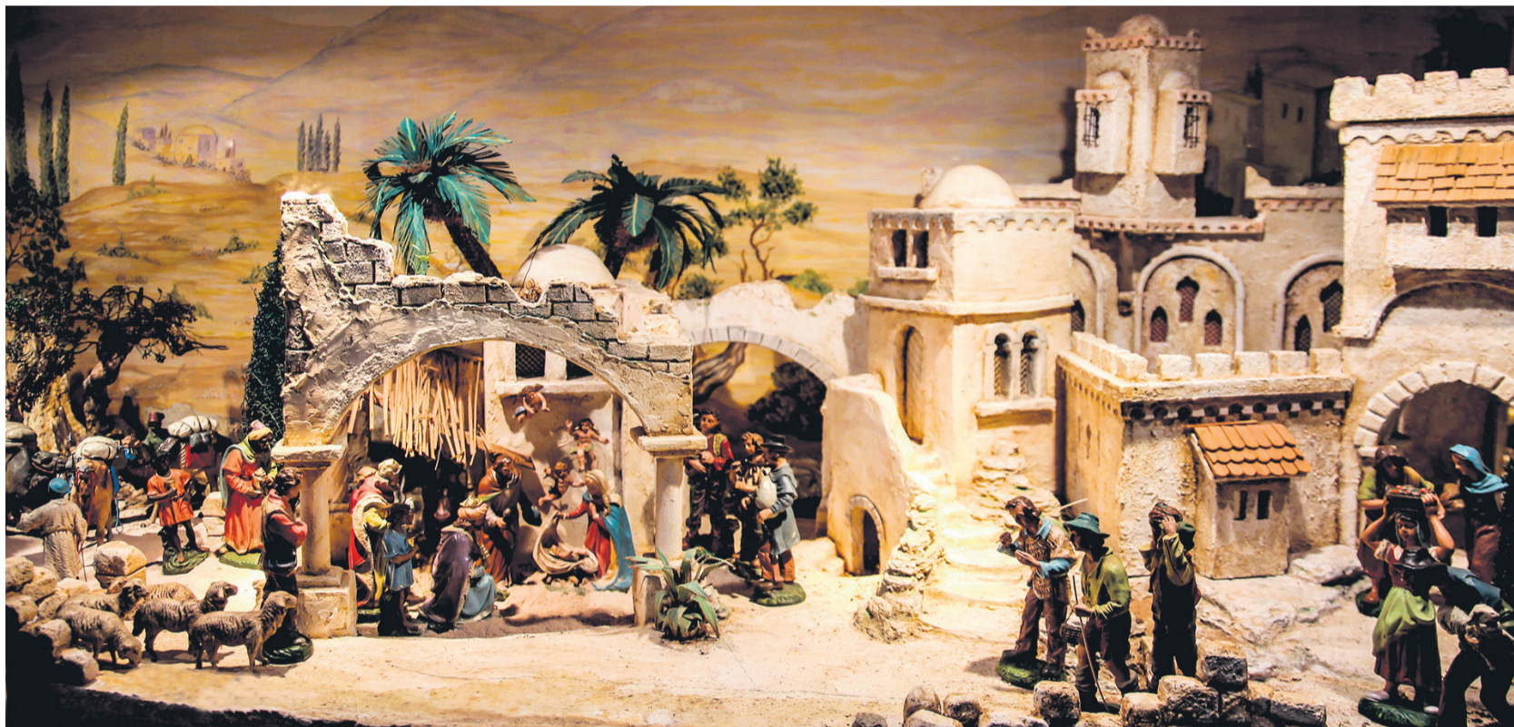
Mit dieser außergewöhnliche Krippenlandschaft wünschen wir „FROHE WEIHNACHTEN!“