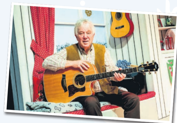
Liedermacher Rolf Zuckowski empfiehlt Familien, sich ein kleines Repertoire an Liedern für besondere Gelegenheiten aufzubauen.

Aktives Singen und Musizieren macht Kinder zudem geduldiger, aufmerksamer, hellhöriger, aufgeweckter, geselliger, auftrittssicherer, entspannter und letztendlich glücklicher.