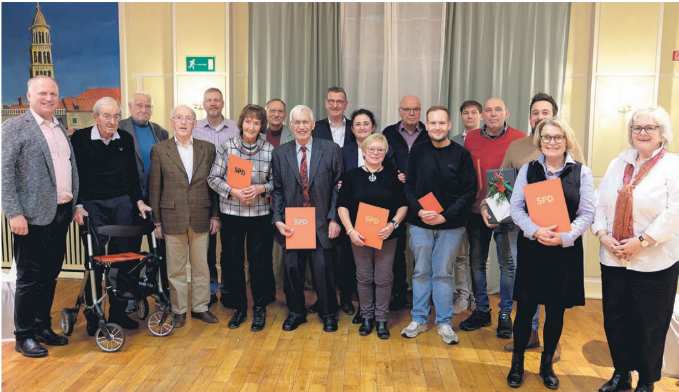
Hundertere Jahre geballte SPD Erfahrung nach den Ehrungen.