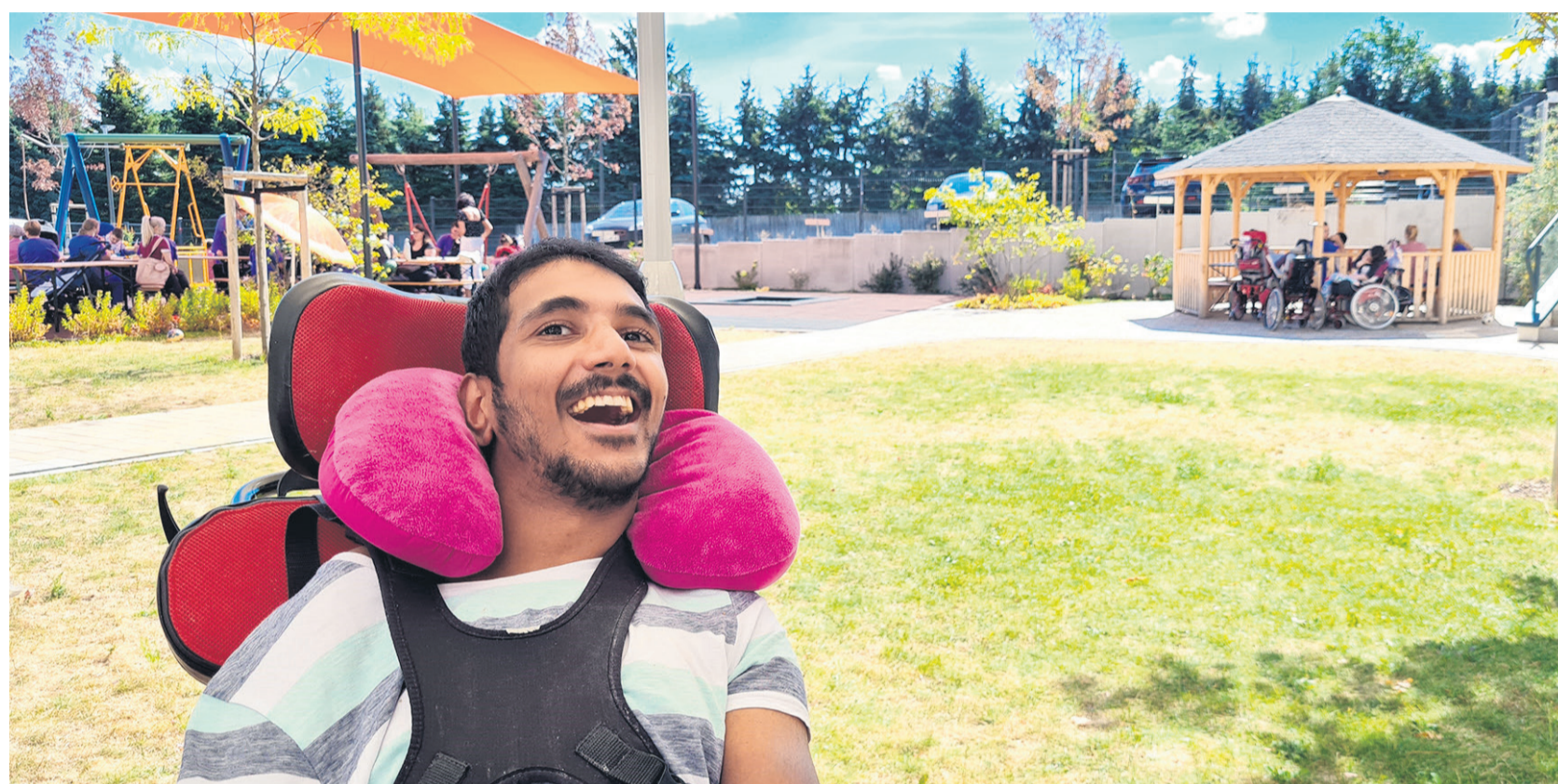
Liebevoller und umfassender Betreuung, Pflege und Förderung stehen im Fokus.

Ein Besuch am 25. November lohnt sich auf jeden Fall