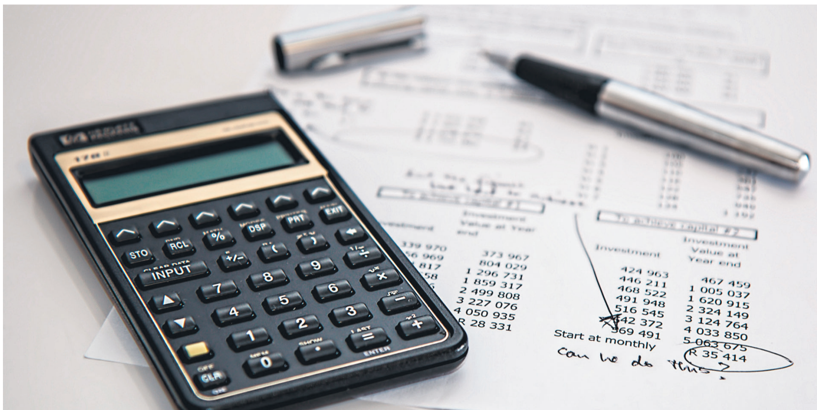
Mit welchen Änderungen ist 2024 zu rechnen?

Idstein bittet um Mithilfe zur Berechnung der Abwassergebühren