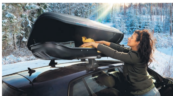
Bei der Fahrt mit einer Dachbox müssen Autofahrer einiges beachten.

auch den Spritverbrauch. Wird die Dachbox nach der Fahrt nicht mehr gebraucht, sollte sie inklusive Dachträger abmontiert werden. ■(ATU)