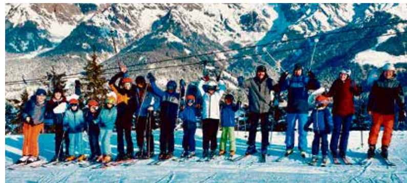
Alle Teilnehmer der SG-Skifahrt hatten mächtig Spaß im Schnee.