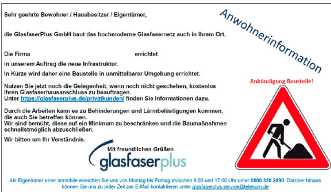
Der sogenannte „Baggerflyer“ der Firma GlasfaserPlus.

Die Baggerflyer haben in erster Linie den Zweck, die Anwohner über die bevorstehenden Arbeiten zu informieren, die zu Beeinträchtigungen vor ihren Häusern führen können. Zusätzlich bieten sie die Möglichkeit zur direkten Kontaktaufnahme mit dem zuständigen Tiefbauunternehmen, inklusive aller relevanten Kontaktdaten.