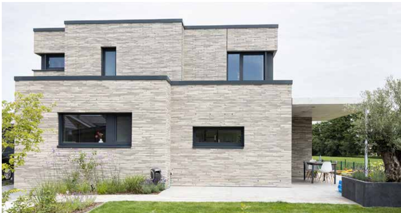
Jenseits einheitlicher Gestaltung: Kommen besonders lange Ziegelsteine bei der Fassadengestaltung zum Einsatz, wirkt das Haus sehr elegant und hochwertig.