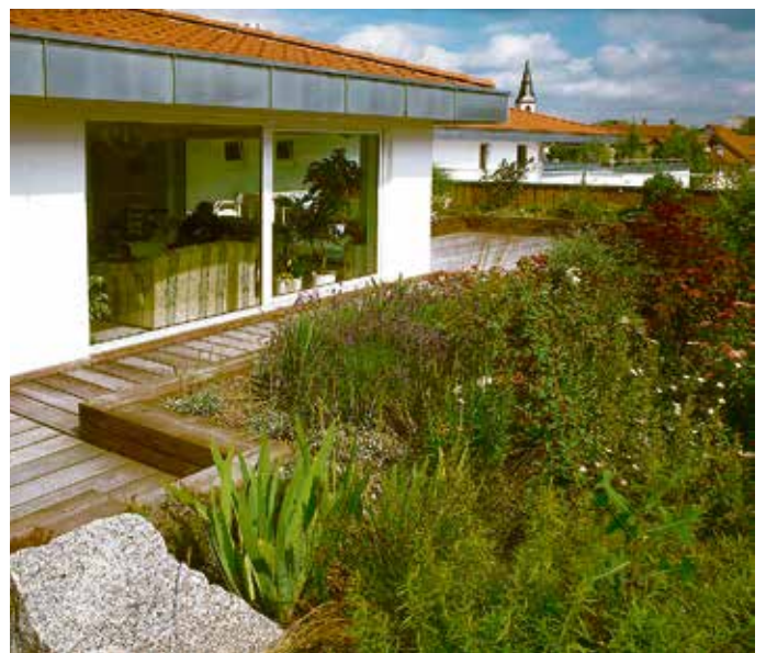
Eine Dachbegrünung verbessert das Mikroklima vor Ort und schafft neue, dringend benötigte Lebensräume für Vögel und Insekten.

Fachhandwerker übernehmen den Aufbau Die Entscheidung für eine Begrünung von Kleinflächen lohnt