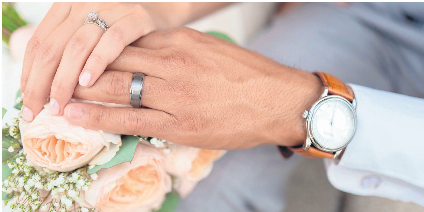
Alles geht! Am 24. April können sich Paare segnen lassen, Eheversprechen erneuern und sich sogar offiziell kirchlich heiraten.

„Trausegen-2-go“ an der Idsteiner Unionskirche