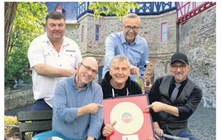
Spielen gegen ihr persönliches Verfallsdatum, „Elder Stagemen.“

unter anderem von Eric Clapton, Canned Heat, Iggy Pop, Creedence Clearwater Revival, Chris Stapleton, Johnny Cash, Bob Dylan, Chris Rea und B.B. King. Auch eigene Songs werden zum besten gegeben, einige davon mit deutschen Texten. Die Elder Stagemen zeigen eindrücklich, wie und wo Musik entsteht. Und gerade weil sie den Traum, mit ihren Rhythmen steinreich und weltberühmt zu werden, längst aufgegeben haben, spürt man ihr ehrliches Verlangenaufrecht zu unterhalten und anzuhören. Einlass 19 Uhr, VVK: 16 Euro inkl. Gebühr, in