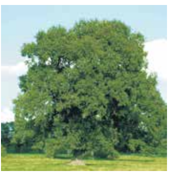
Große alte Bäume leisten viel für die Umwelt. Sie filtern die Luft, beeinflussen die Temperatur, binden Kohlendioxid und sind willkommene Schattenspendler.

ein paar Jahrzehnten im Garten oder im Park stehen, leisten bereits einen wichtigen Beitrag zur Erhaltung einer gesunden, lebenswerten Umwelt - der Erhalt ist vor diesem Hintergrund einer Neuanpflanzung vorzuziehen, wo immer dies möglich ist.