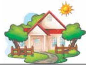
Üppiger Austrieb, Blüten- und Fruchtsatz und die Gesundheit schöner alter Bäume lassen sich mit biologischen Vitalkuren stärken.

Hausmeisterservice Bergmann 65232 Taunusstein Objekt- und Gartenpflege Tel.: 06128/982793 Mobil: 0170-9852090 info@bergmann-garten.de