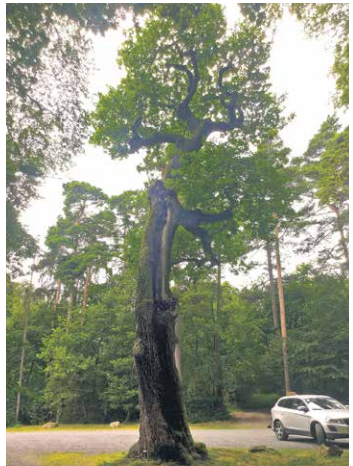
Baumriesen, die Schwäche zeigen, kann eine biologische Vitalkur zu neuer Lebenskraft verhelfen.

Geringe Niederschläge wirken sich auf größere Bäume nicht unmittelbar aus, da ihre Wurzeln tief reichen. Eine dauerhafte Unterversorgung mit Wasser ist aber zu vermeiden. Eine ausreichende, gut dosierte Bewässerung muss daher sichergestellt werden, hierzu eignen sich bei kleineren Bäumen auch die Bewässerungsbeutel, die man häufiger in öffentlichen Parkanlagen sieht. Zusätzliche Lebenskraft und mehr Widerstandsfähigkeit gegen Baumkrankheiten geben zudem biologische Vitalkuren wie Waldleben. Die biologisch wirksamen, natürlichen Inhaltsstoffe verbessern das Bodenleben und fördern das Wurzelwachstum und die sogenannten Mykorrhiza, das sind symbiotisch mit den Wurzeln verbundene Pilze. Die Präparate können nicht nur auf den Boden, sondern auch auf die verholzten Teile des Baums aufgebracht werden, wo sie direkt aufgenommen werden und