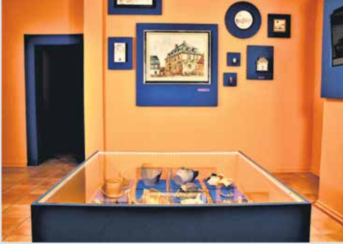
Blick in die neue Ausstellung Taunussteiner Geschichte(n) neu erzählt: Das Wehener Schloss in Kitsch und Kunst. Zentral ein Gemälde von Walter Prescher van Ed. Am Boden darunter: Keramische Artefakte aus der Schlossküche, 17./18. Jahrhundert.

In seiner frisch gestalteten Ausstellung, Taunussteiner Geschichte(n) neu erzählt, beschäftigt sich das Stadtmuseum Taunusstein mit Aspekten der lokalen Geschichte. In der Serie der Taunussteiner Stadtnachrichten werden nun monatlich Themen und Objekte vorgestellt, die schlaglichtartig den Fokus auf unsere Region richten. Da ist es naheliegend, für Teil #1 der Aufsätze, den Standort des Museums, das Wehener Schloss, zu wählen.