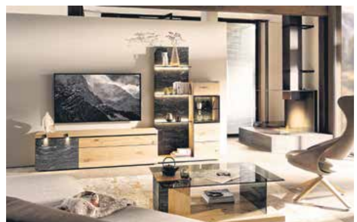
Alpines Holz und Granit in Harmonie: Natürliche Materialien verleihen dem Zuhause ein besonderes Flair.