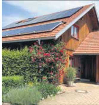
Die Kombination von Solarthermie und Photovoltaik ist eine ökologisch und ökonomisch sinnvolle Kombination – vor allem, wenn sie aus einer Hand stammt.

„Für die Umrüstung eines Hauses mit Photovoltaik und Solarthermie ist zwar erst einmal eine Investition notwendig. Die Kosten liegen jedoch immer noch deutlich unter vergleich-