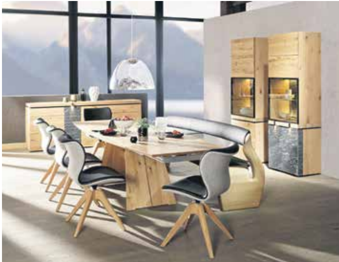
Dank hochwertiger Materialien aus der Natur vermittelt der Essbereich alpine Gemütlichkeit.

Naturmaterialien und der Kontrast von Holz und Stein prägen die Inneneinrichtung