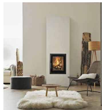
Moderne, CO 2 -neutrale Holzheizsysteme überzeugen durch hohe Effizienz, niedrige Emissionswerte und einen sparsamen Verbrauch.

Erich-Kästner-Str. 3 · 65232 Taunusstein-Hahn Tel. (0 61 28) 93 54 06 · Fax (0 61 28) 93 54 08 WWW.GLASEREI-SCHMITT.DE