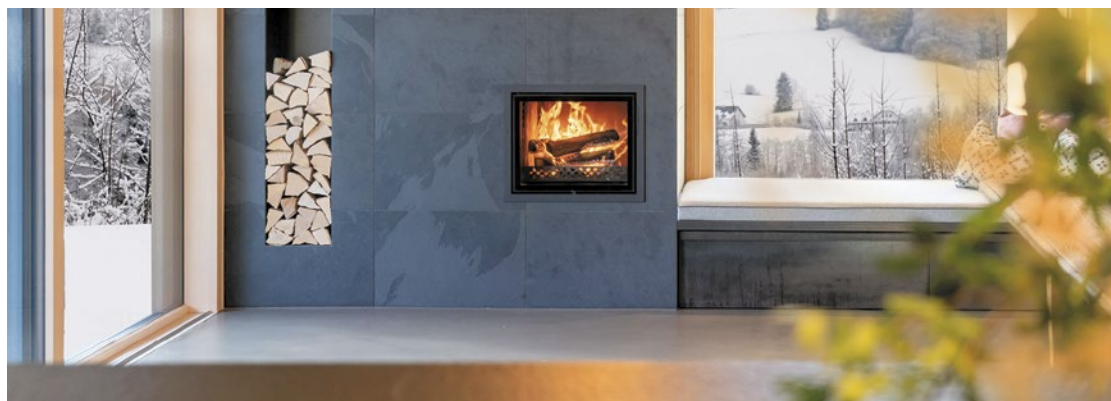
Holzfeuerstätten wie Speichergrundöfen mit Wasserwärmetauscher können auch eine Wärmepumpe ideal ergänzen und entlasten.

Die Anfang 2025 vollständig in Kraft getretenen Regelungen der Bundesimmissionschutzverordnung (BImSchV) betreffen ausschließlich ältere Feuerstätten, die vor dem 22. März 2010 in Betrieb genommen wurden und die