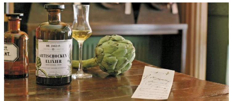
Das Artischocken-Elixier ist ein Bitterschnaps auf Artischocken-Basis mit mehr als 30 Klosterkräutern, Blüten und Wurzeln. Man kann ihn pur oder mit Tonic Water bzw. Ginger Ale genießen. Durch die Bitterkräuter auch beliebt nach dem Essen.

Besuchen Sie auch unsere Homepage www.cms-verbund.de