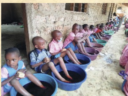
Behandlung an einer der vielen Schulen

Wir haben uns zum Ziel gesetzt, pro Jahr zwischen 15.000 und 20.000 Menschen (überwiegend Kinder) in Kenia von Jiggers zu befreien und ihnen so ein Stück