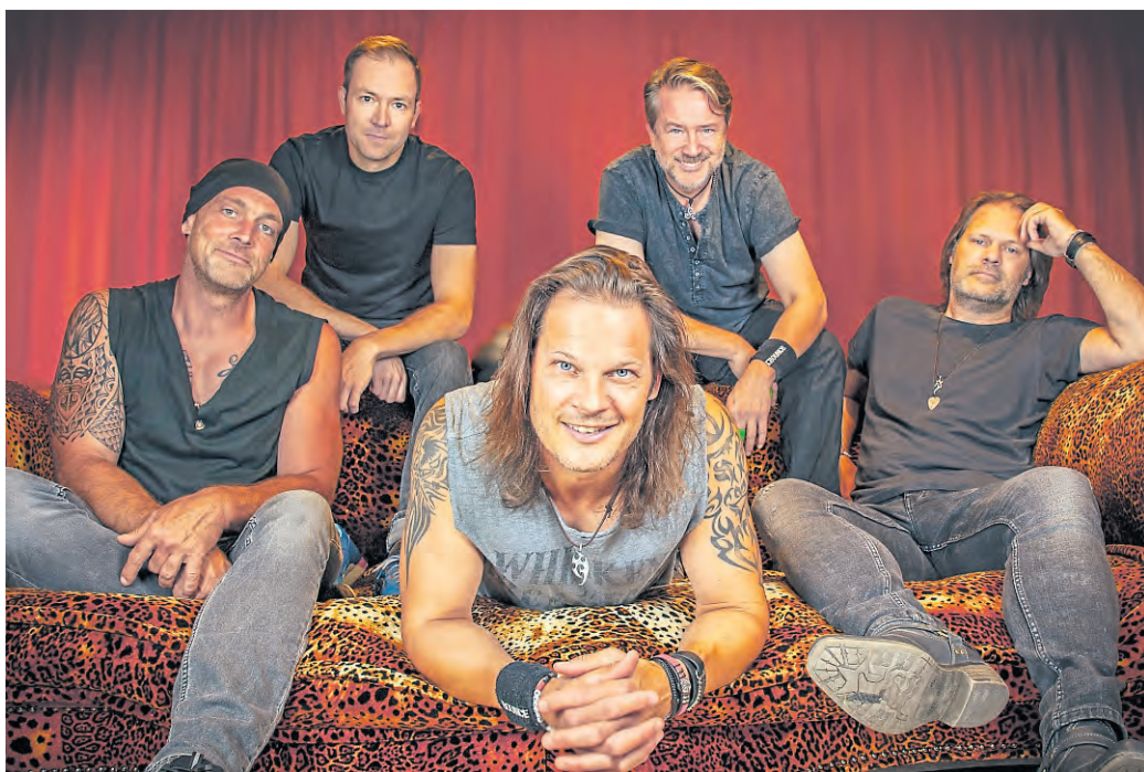
Die Bon Jovi-Tribute Band „Bounce“.

Vom ersten Hit „Runaway“ über All-Time-Favourites wie „You Give Love A Bad Name“, „Livin' On A Prayer“, „Keep The Faith“, „Bed Of Roses“, „It's My Life“ oder „Have A Nice Day“ bis hin zu aktuellen Songs wie „We Weren't