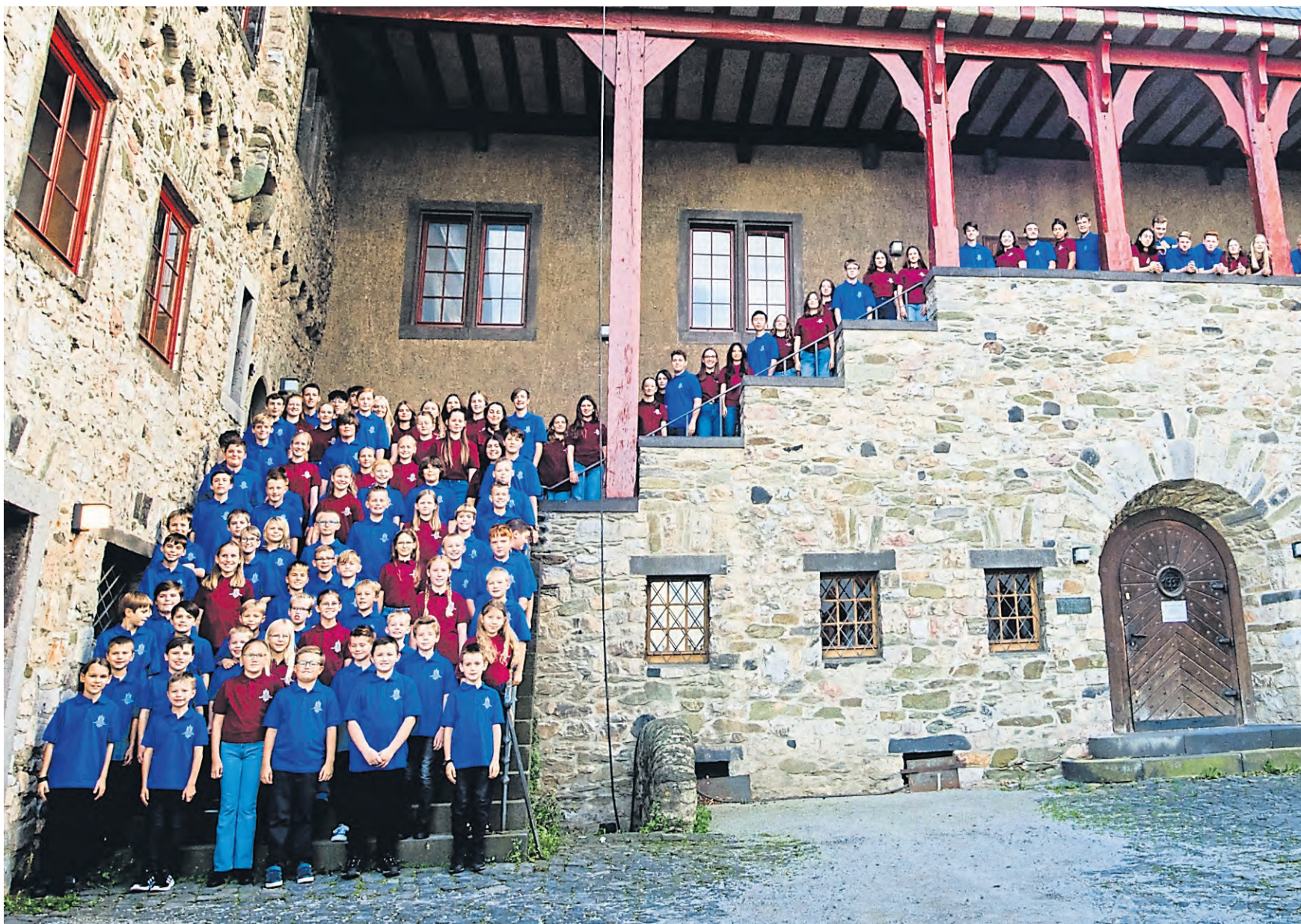
Die Limburger Domsingknaben und die Limburger Mädchenkantorei.

Konzert im Limburger Dom zum Innehalten und Nachdenken