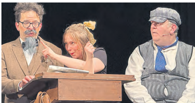
Mit der Feuerzangenbowle weckt das Künstlerhaus43 nostalgische Erinnerungen.

Nostalgie und Witz: Künstlerhaus43 präsentiert „Die Feuerzangenbowle“ im Palasthotel