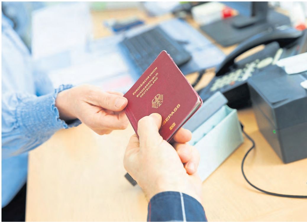
Der Reisepass ist die „Eintrittskarte“ in viele Länder der Erde.

Das Passfoto muss den aktuellen biometrischen Vorgaben entsprechen. Das Kind muss eindeutig erkennbar sein. Insbesondere bei Säuglingen und Kleinkindern ist auf eine geeignete Aufnahme zu achten. Hat sich das Aussehen des Kindes deutlich verändert, ist gegebenenfalls