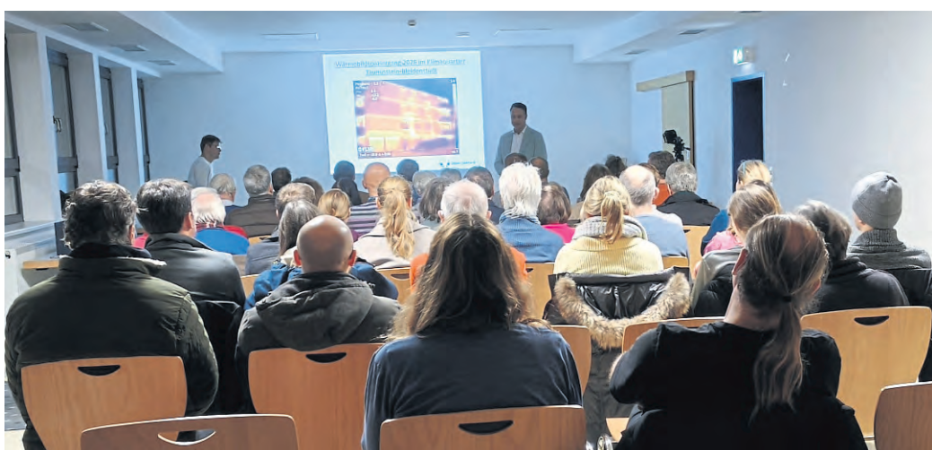
Infoveranstaltung zum Wärmebildspaziergang im Klimaquartier Bleidenstadt Süd: Bürgermeister Joachim Reimann hält einleitende Worte.

Nach einleitenden Worten durch Bürgermeister Joachim Reimann erläuterte ein ortssansässiger Energieberater die Grundlagen der Thermografie. Er erklärte, wie Wärmebilder entstehen, welche Informationen sie liefern und welche Rückschlüsse sich daraus für Wohngebäude ziehen lassen. Im anschließenden virtuellen Wärmebildspaziergang arbeiteten die Teilnehmenden mit anonymisierten Wärmebildern aus dem Arbeitsalltag des Energieberaters. Gemeinsam analysierten sie, an welchen Stellen Gebäude Wärme verlieren, wie die Aufnahmen fachgerecht zu interpretieren sind und welche Maßnahmen