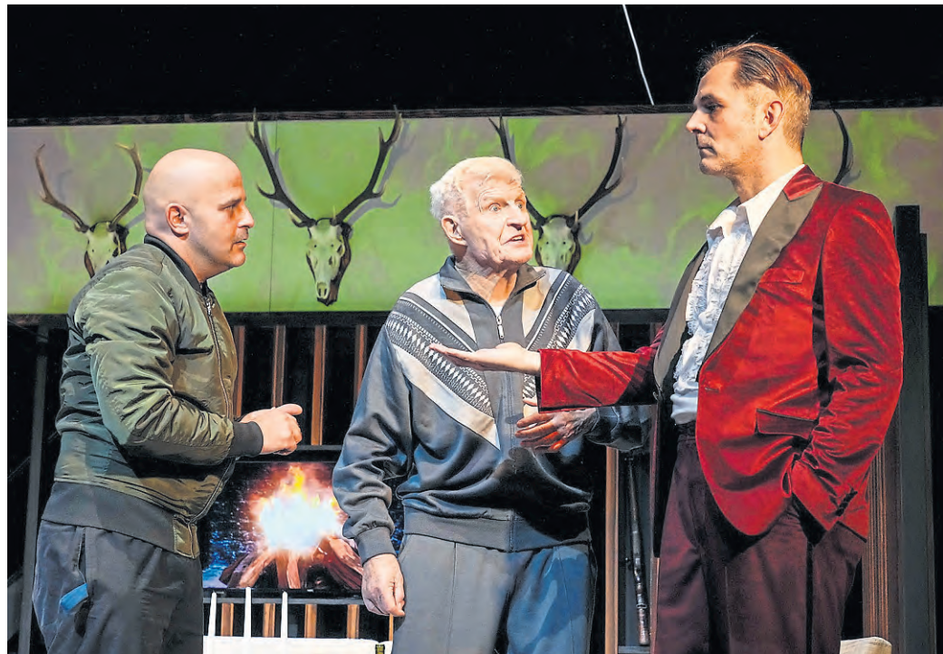
Szene aus dem Theaterstück „Biedermann und die Brandstifter“.

Biedermann und die Brandstifter am 4. März in der Stadthalle