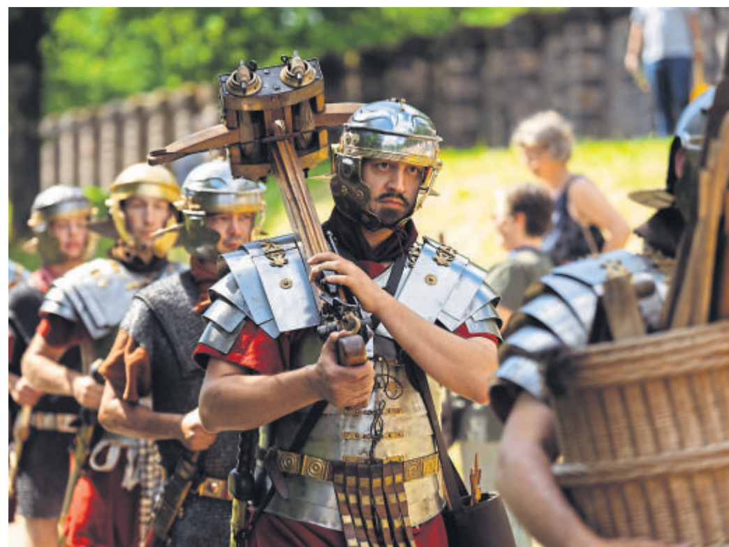
Soldaten mit Geschütz.

Zudem gibt es ein buntes Programm mit verschiedenen Aktionen zur römischen Antike: Handwerkerinnen und