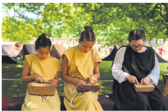
Szene aus dem Römerlager.

Handwerker wie Lampenmacher, Töpfer, Knochenschnitzer führen ihre Künste vor, es