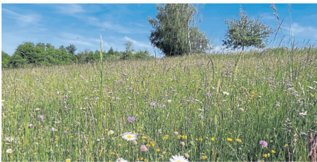
Artenreiche Wiese zur Blütezeit.

Die Landbewirtschaftler sorgen durch die richtige Pflege