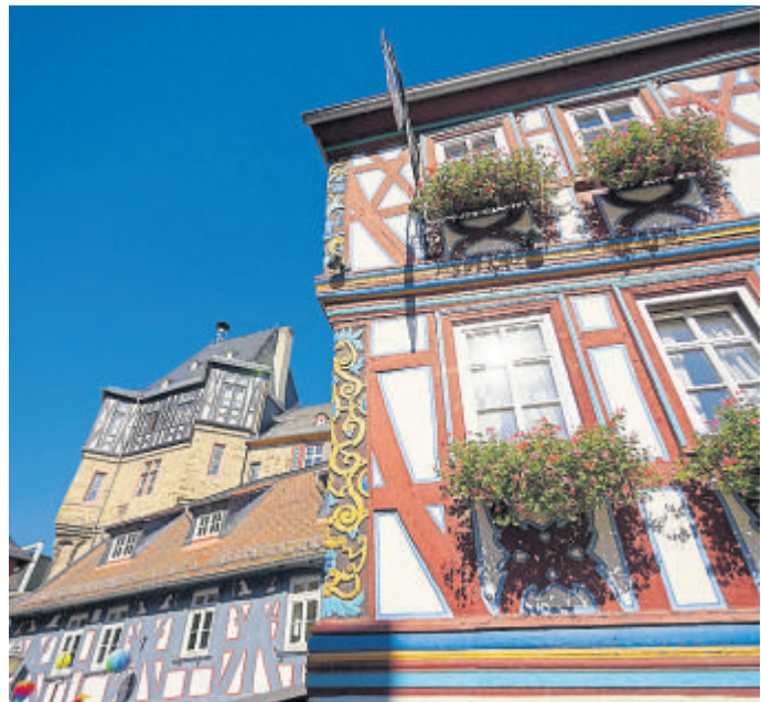
Eindrucksvolles Fachwerk in Idstein.

Karten sind samstags ab 11 Uhr und sonntags ab 14 Uhr in der Tourist-Info Idstein / Killingerhaus erhältlich. Die Tourist-Info ist unter Telefon 06126-78-620 zu erreichen oder per E-Mail unter tourist-info@idstein.de .