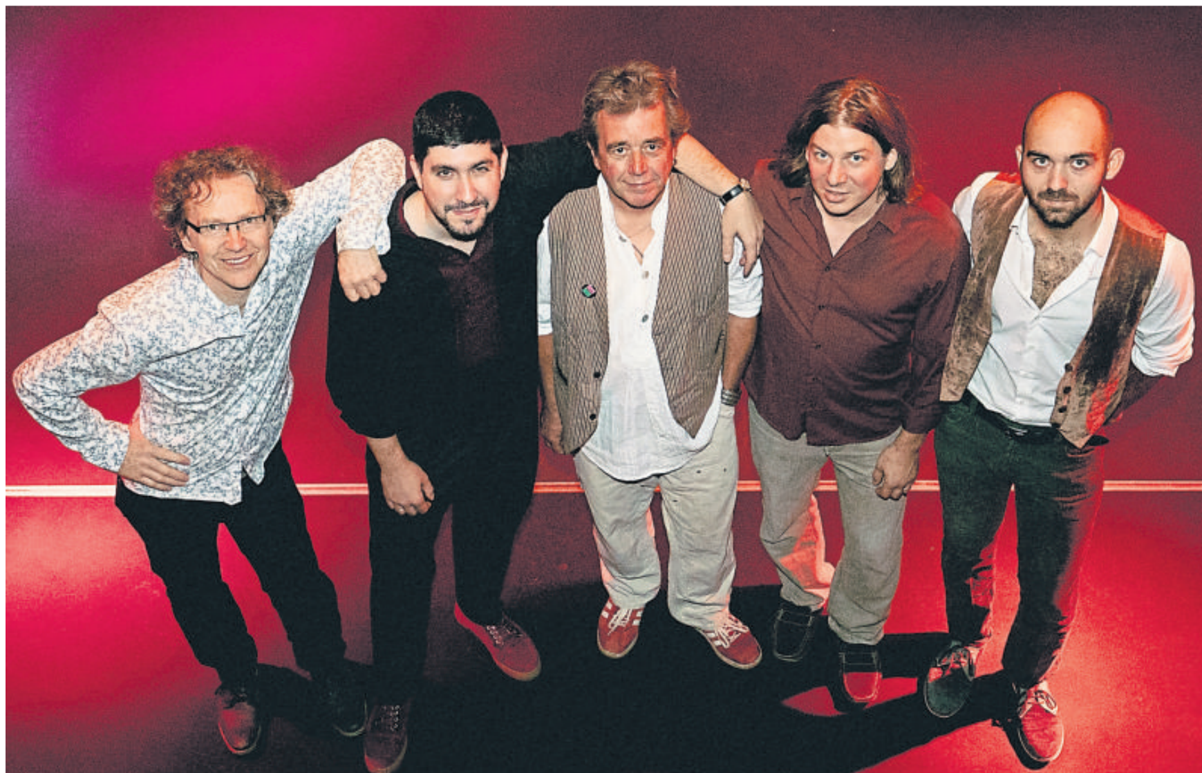
Mit der Band Absinto Orkestra geht auf eine musikalische Reise durch den Balkan und rund ums Mittelmeer.

45 Jahre Folk-Club Taunusstein und 50 Jahre Ar Log aus Wales