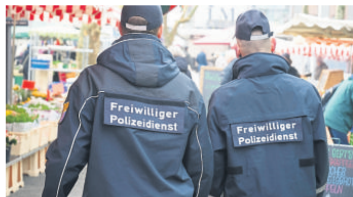
Jetzt für den Freiwilligen Polizeidienst bewerben.

Bad Schwalbach/Region (ots/red). Wer sich ehrenamtlich engagieren und gleichzeitig einen Beitrag zur öffentlichen Sicherheit leisten möchte, für den könnte der Freiwillige Polizeidienst genau das Richtige sein. Folgende Kommunen sowie ein Landkreis wollen unter dem Motto „Präsenz zeigen, beobachten, melden“ die Anzahl ihrer Freiwilligen Polizeidienstnehmer erhöhen oder den Freiwilligen Polizeidienst erneut in ihrer Kommune einführen: Hochtaunuskreis, Stadt Geisenheim, Stadt Oestrich-Winkel, Stadt Bad Schwalbach, Stadt Limburg an der Lahn, Ge-