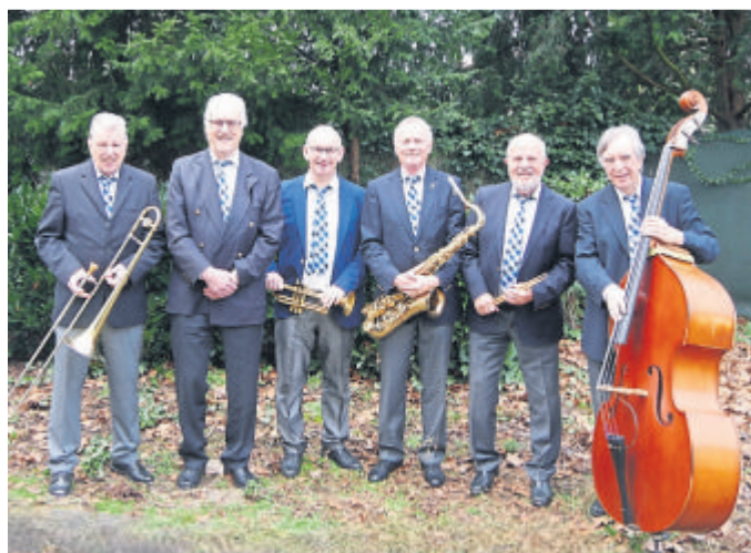
Die Wiesbadener Juristenband spielt im Kurhaus.

55 Jahre Wiesbadener Juristenband: Konzert im Kurhaus Bad Schwalbach