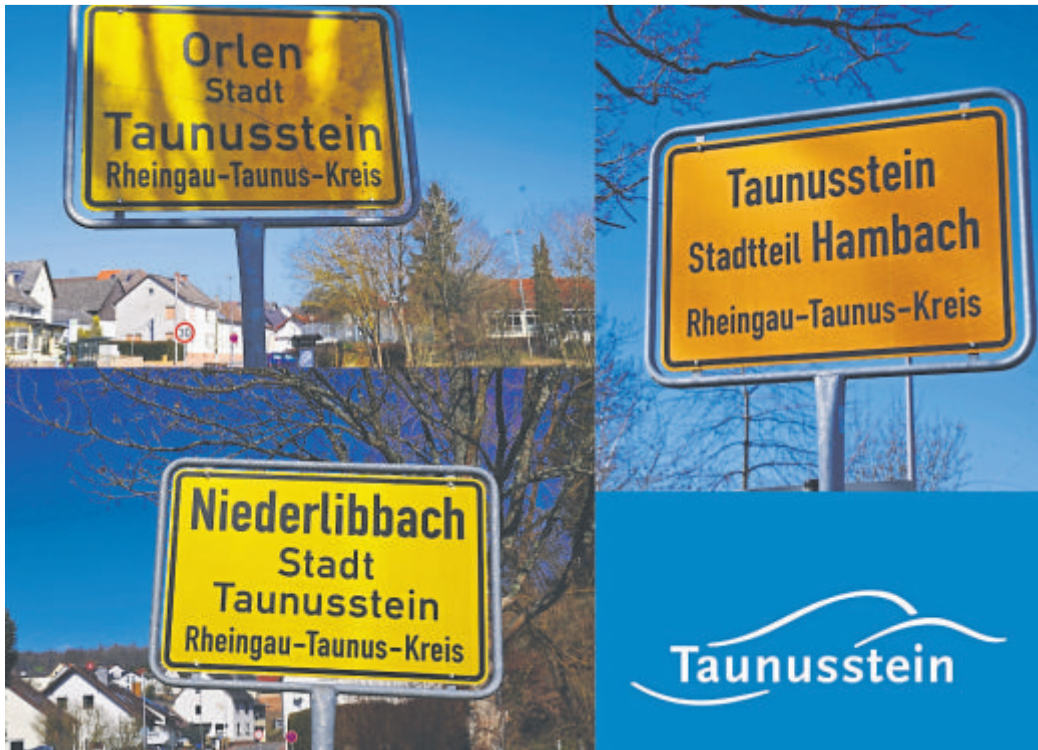
Jetzt sind Orlen, Hambach und Niederlibbach mit den Workshops an der Reihe.

Taunusstein (red). Im Mai setzt die Stadt Taunusstein die Dorfmoderation in Hambach, Niederlibbach und Orlen mit weiteren Beteiligungsformaten fort. In drei Bürgerworkshops haben Einwohnerinnen und Einwohner die Möglichkeit, sich aktiv in die Entwicklung ihrer Ortsteile einzubringen und eigene Ideen für das Kommunale Entwicklungskonzept vorzuschlagen. Die Veranstaltungen finden jeweils um 18 Uhr an folgenden Terminen statt: am 4. Mai in Niederlibbach (Mehrgenerationenhaus), am 6. Mai in Orlen (Zugmantelhalle) und am 18. Mai in Hambach (Alte Feuerwehr). Eine Anmeldung ist nicht erforderlich. Die Workshops richten sich vorrangig an die Bewohnerinnen und Bewohner der jeweiligen Stadtteile.