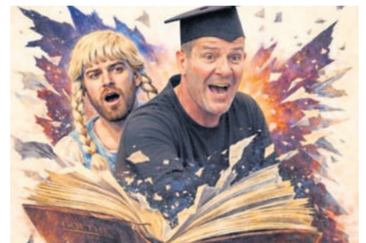
Ein Stück zwischen Klassik und Komik: Fast Faust.