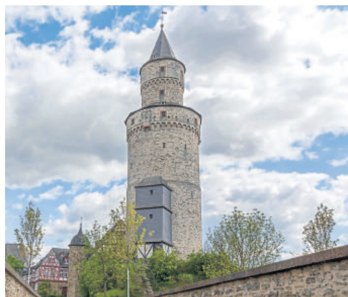
Ein Wahrzeichen von Idstein: Der Hexenturm.