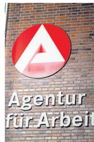
Das grundlegende Bild am Arbeitsmarkt verändert sich nicht.

Im Rechtskreis SGB III (Agentur für Arbeit) lag die Arbeitslosigkeit bei 5.781 Per-