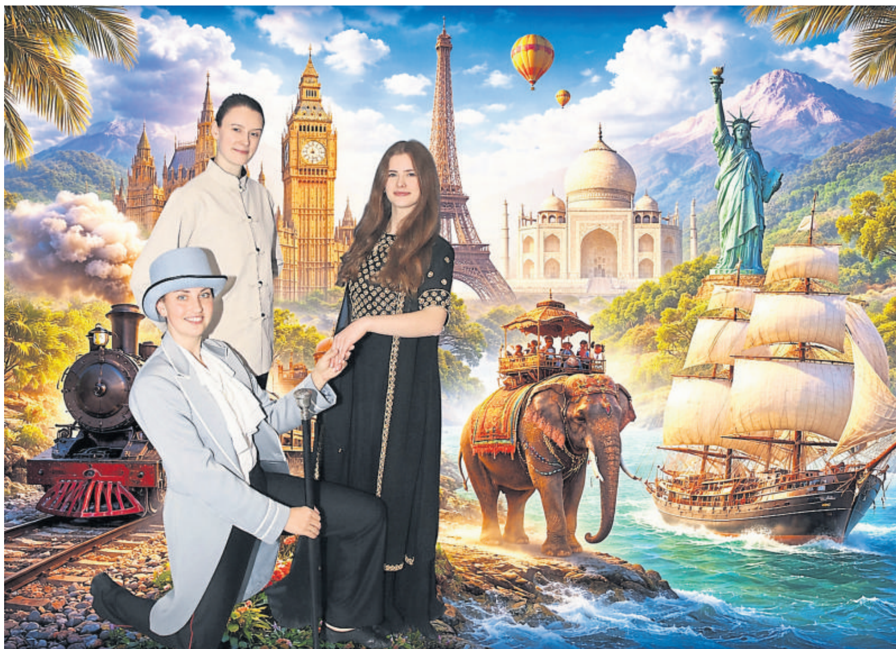
Die Show basiert auf dem Klassiker „In 80 Tagen um die Welt“ und erzählt die Geschichte des englischen Gentleman Phileas Fogg.

Showtanz-Ensemble des TV Hahn zeigt „In 80 Tagen um die Welt“ im Bürgerhaus Taunus