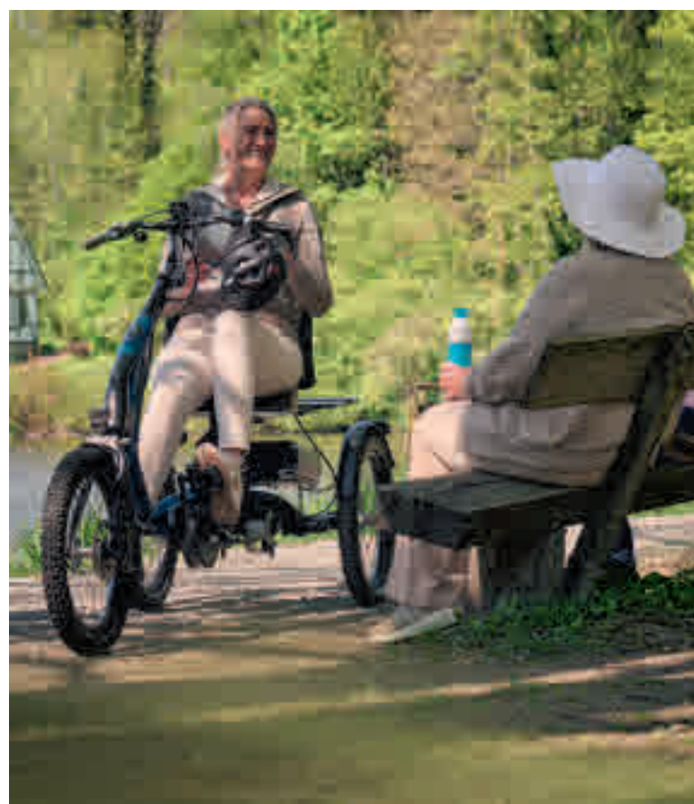
Am 12. Mai 2026 findet der Mobilitätstag in der e-motion e-Bike Welt Wiesbaden in Walluf statt. Ein Besuch der sich lohnt!

Was tun, wenn weder Auto noch e-Bike mehr sicher scheint, man aber seine Mobilität erhalten oder wieder gewinnen will?