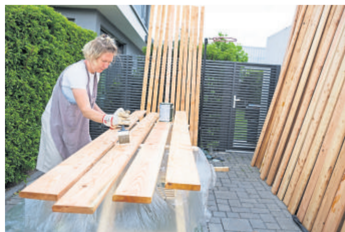
Alte und auch neue Terrassendielen bleiben länger haltbar und ansehlich, wenn sie mit einer Lasur oder mit Holzöl behandelt werden.

Richtige Pflege verlängert die Nutzung – bei Neukauf auf Siegel achten