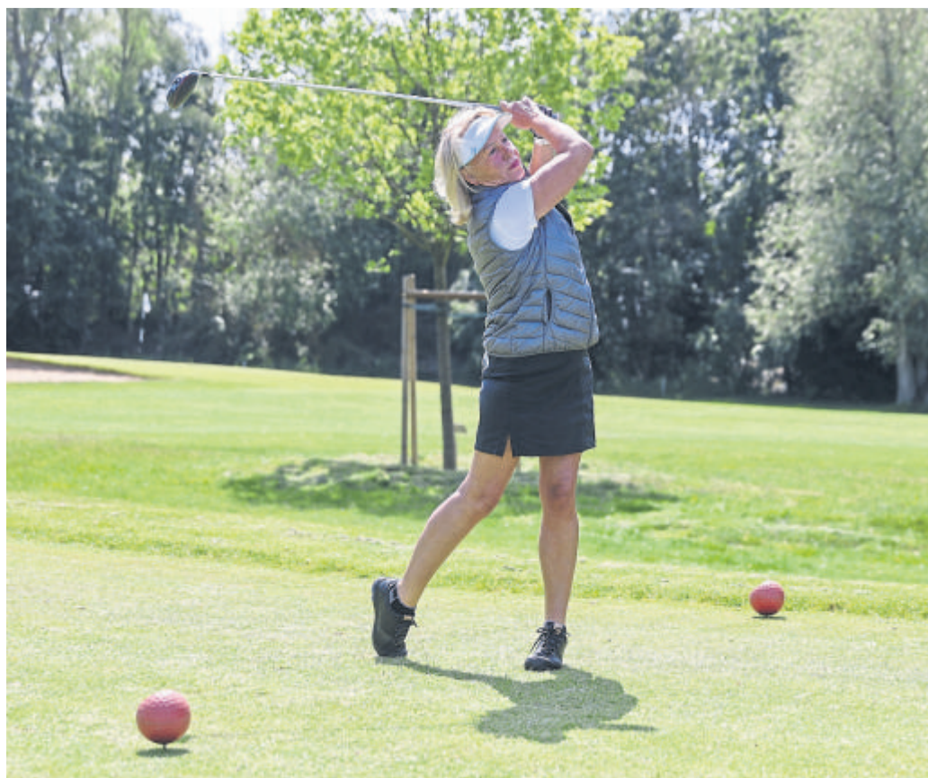
Ausholen, Schwung holen und gezielt abschlagen – das ist beim „Tag der offenen Tür“ auch für Ungernde möglich.

Mit der Kampagne „Einfach mal abschlagen“ verfolgt der Hessische Golfverband das Ziel, Berührungsängste abzubauen, Vorurteile gegenüber dem Golfsport zu reduzieren und Golf als vielseitigen Freizeit-, Familien- und Natursport sichtbar zu machen. Unterstützt wird die Aktion durch eine landesweite Kooperation mit Hit Radio FFH, wodurch der Golfsport bereits in der Woche vom 4. bis 8.