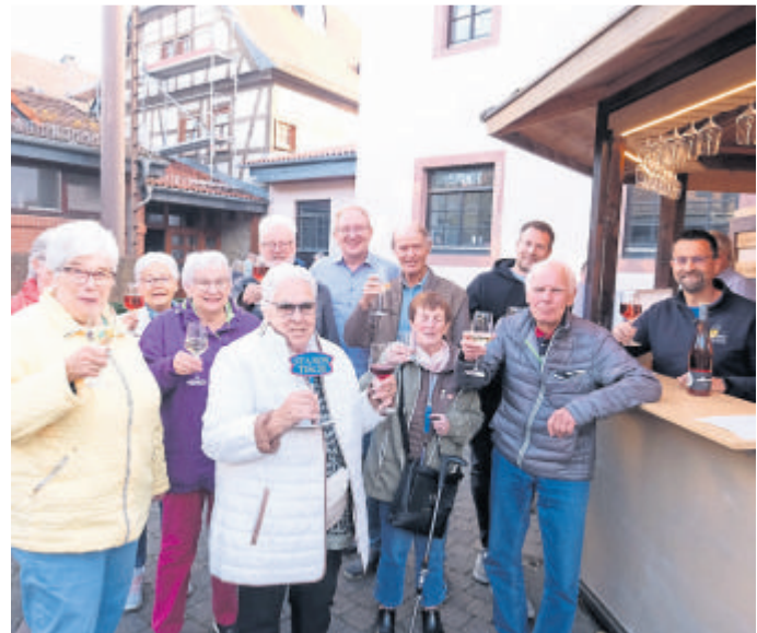
Prost! Geselligkeit und ein freundliches Miteinander gibt's beim Weinstand.

Die Braaderter Woachebauer freuen sich auf zahlreiche Gäste und ein paar schöne Frühlings- und Sommerabende.