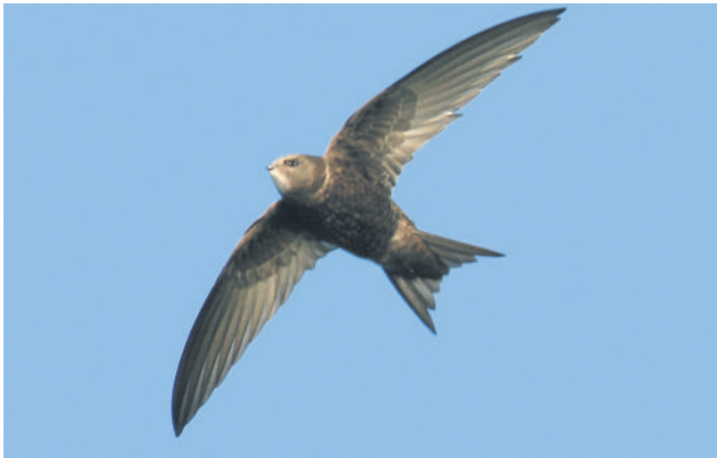
Mauersegler gehören zu den geschützten Tierarten, auch ihre Nester sind geschützt.