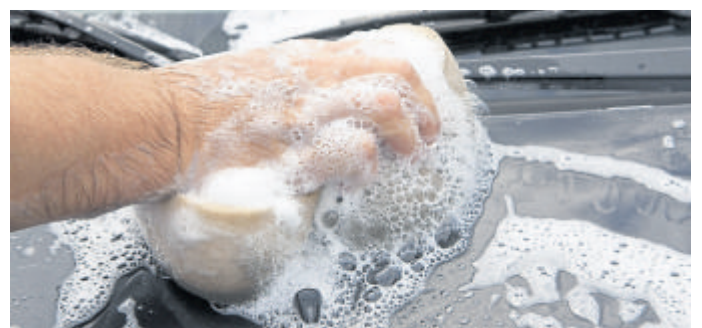
Gut einweichen und dann mit einem weichen Schwamm reinigen – dann gehören die Insektenreste schon bald der Vergangenheit an.