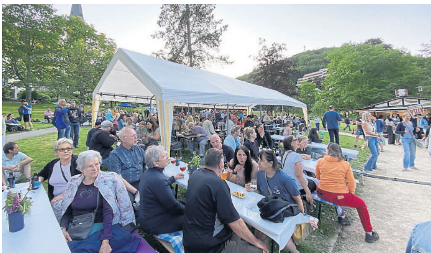
Wenn das Wetter stimmt, wird der Untere Kurpark mit Sicherheit wieder gut besucht sein.

www.buchhandlung-libera.de Tel. 06128/84420