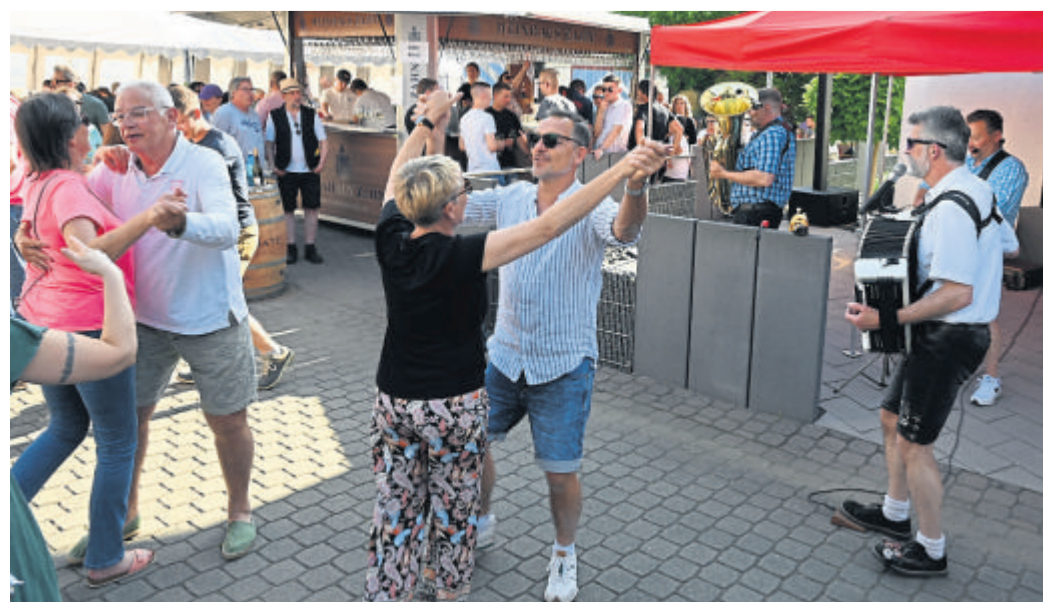
Die Live-Musik beim Schobbe Festival lädt zum Tanzen ein.