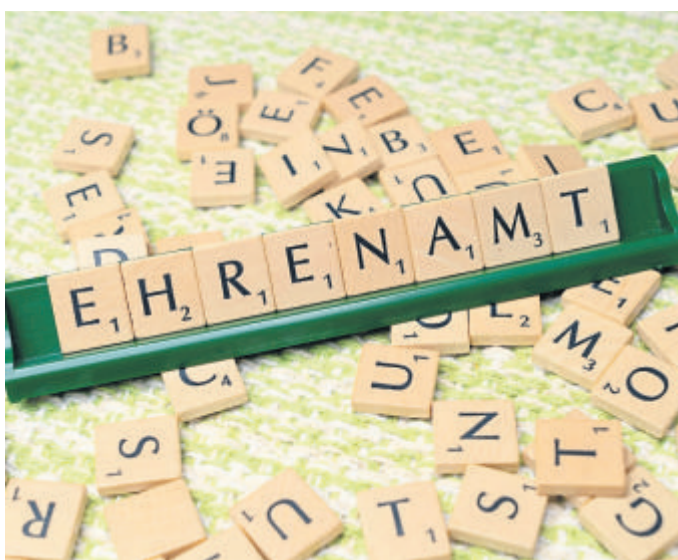
Die Planung kleiner Vortragsreihen oder Spielenachmittage gehört auch zum Angebot.

Taunusstein (red). Die Stadt Taunusstein sucht ehrenamtliche Helferinnen und Helfer für die städtischen Seniorenclubs, Seniorentreffs und den Senioren-Kulturkreis. Ziel ist es, die regelmäßigen Angebote in den Stadtteilen weiterhin verlässlich zu gestalten und gemeinsam mit engagierten Bürgerinnen und Bürgern weiterzuentwickeln. In den Stadtteilen Hahn, Wehen, Neuhof, Wingsbach, Niederlibbach, Watzhahn und Bleidenstadt finden regelmäßig Treffen für ältere Menschen statt. Diese bieten Raum für Austausch, gemeinsame Aktivitäten und kulturelle Impulse. Damit diese Angebote bestehen bleiben und vielfältig gestaltet werden können, wird Unterstützung bei der Organisation und Durchführung ge-