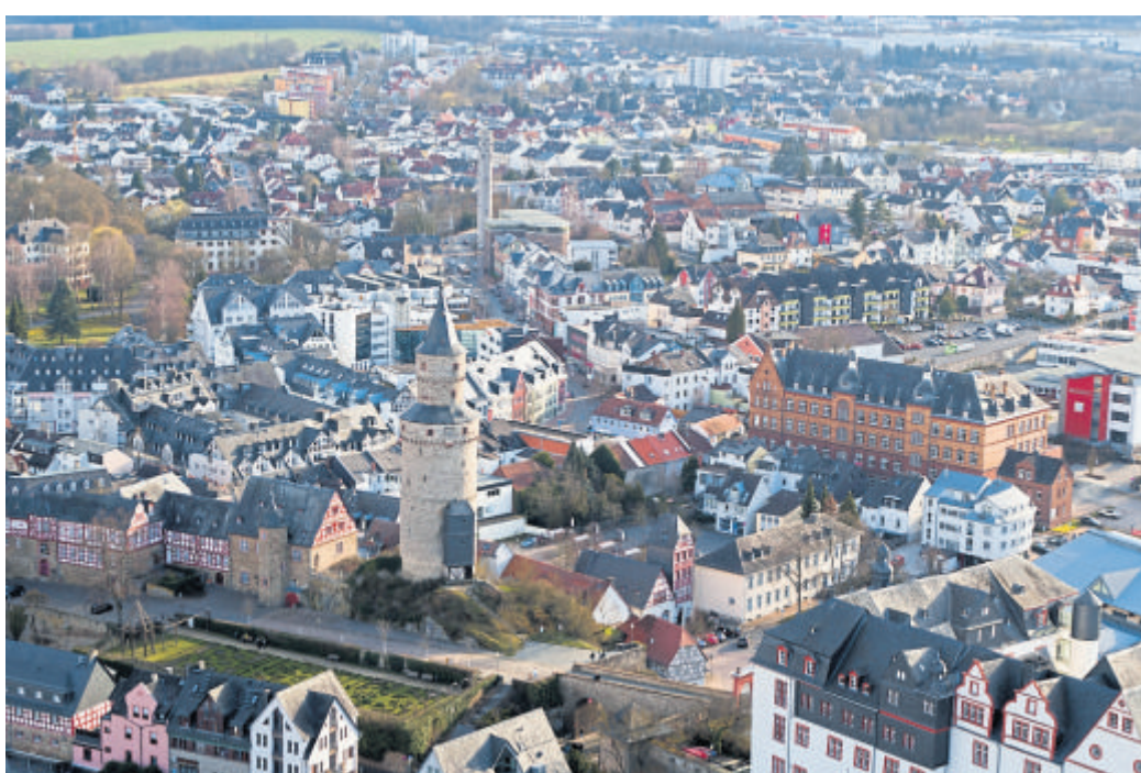
Gemeinsam mit dem Idsteiner Gästeführer schlendern die Teilnehmer bei einem Innenstadtbummel durch Straßen und Gassen..

Für Sonntag, 17. Mai, laden die Idsteiner Gästeführer Jung und Alt dazu ein, sich von dem im Renaissancestil erbauten Residenzschloss der Grafen und Fürsten von Nassau-