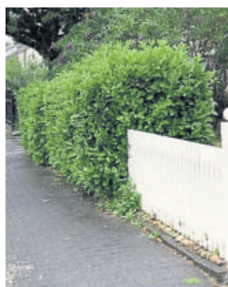
Überwuchs kann dazu führen, dass Gehwege nicht mehr uneingeschränkt nutzbar sind.

Für den Rückschnitt gilt: Hecken und Sträucher sind entlang der Grundstücksgrenze zu schneiden. Über Gehwegen ist eine lichte Höhe von mindestens 2,25 Metern freizuhalten, über Fahrbahnen mindestens 4,50 Meter. Bei Fahrbahnen ohne Gehweg ist der Bereich vollständig entlang der Grenze freizuhalten. Auch an Gehwegen ist grundsätzlich grenzlinnig freizuhalten; ein Überhang von maximal 0,20 Metern ist nur zulässig, wenn eine Restgehwegbreite von mindestens 1,00 Meter bestehen bleibt.