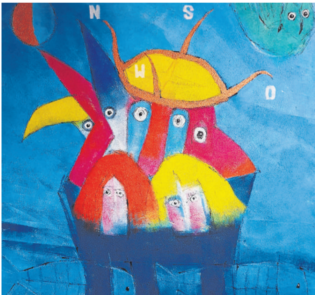
Dieses Bild trägt den Titel „Narrenschiff“..