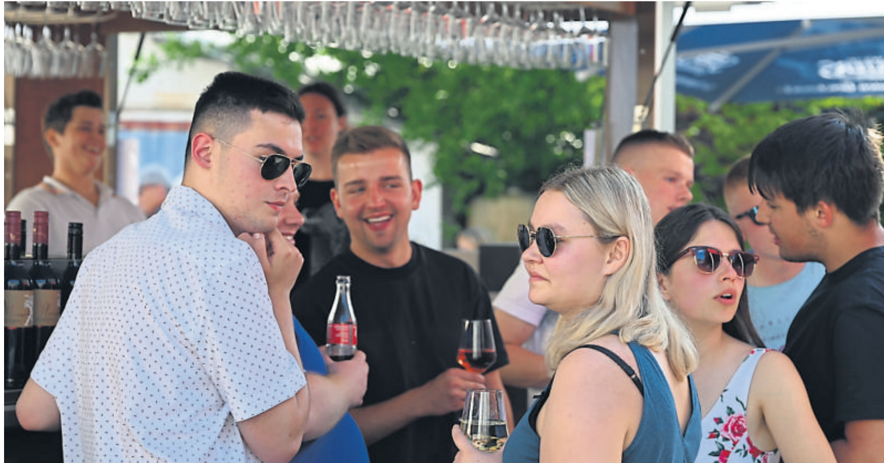
Chillen am Weinstand und dabei gute Tropfen genießen.

Großes Jubiläumfest zum 55-jährigen Bestehen mit Live-Musik, köstlichen Weinen und leckerem Essen