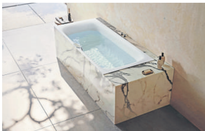
Tiefe Entspannung finden mit Infrarotwärme, Ambientebeleuchtung und einem unsichtbaren Soundsystem.

rungen eine stimmungsvolle Atmosphäre und beruhigen die Augen.