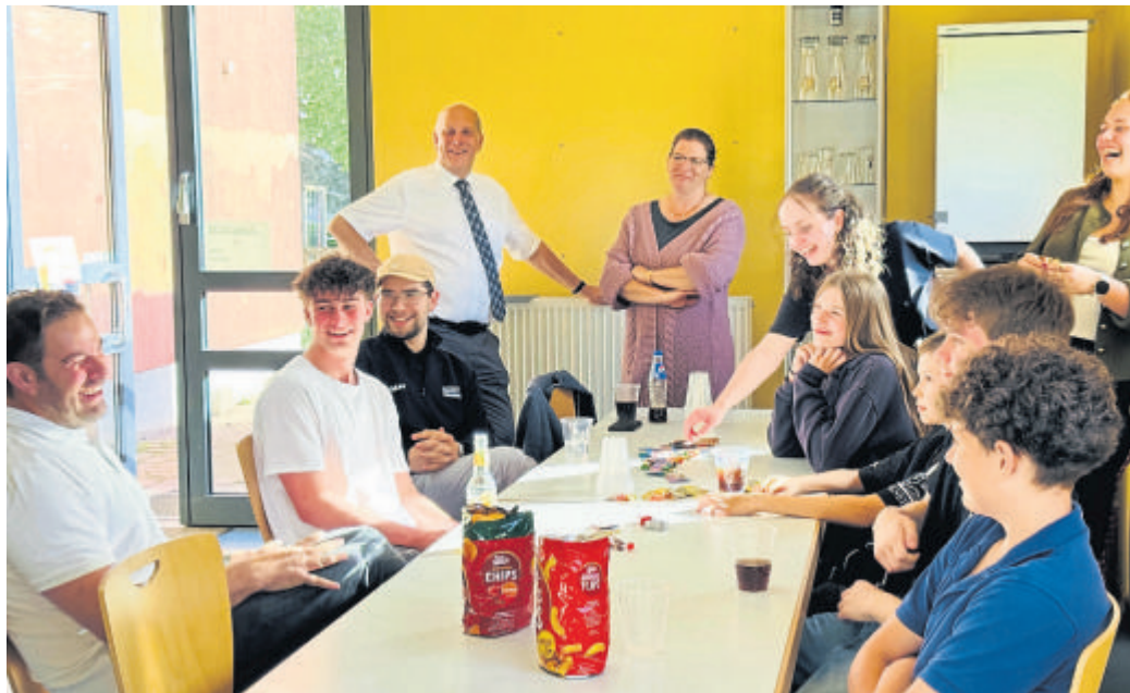
Die dritte Runde des Jugenddialogformats „Zocken mit Zehner“ fand diesmal auf der Kegelbahn in Kessel statt.

Veranstaltungsreihe des Jugendbildungswerks im Rheingau-Taunus-Kreis