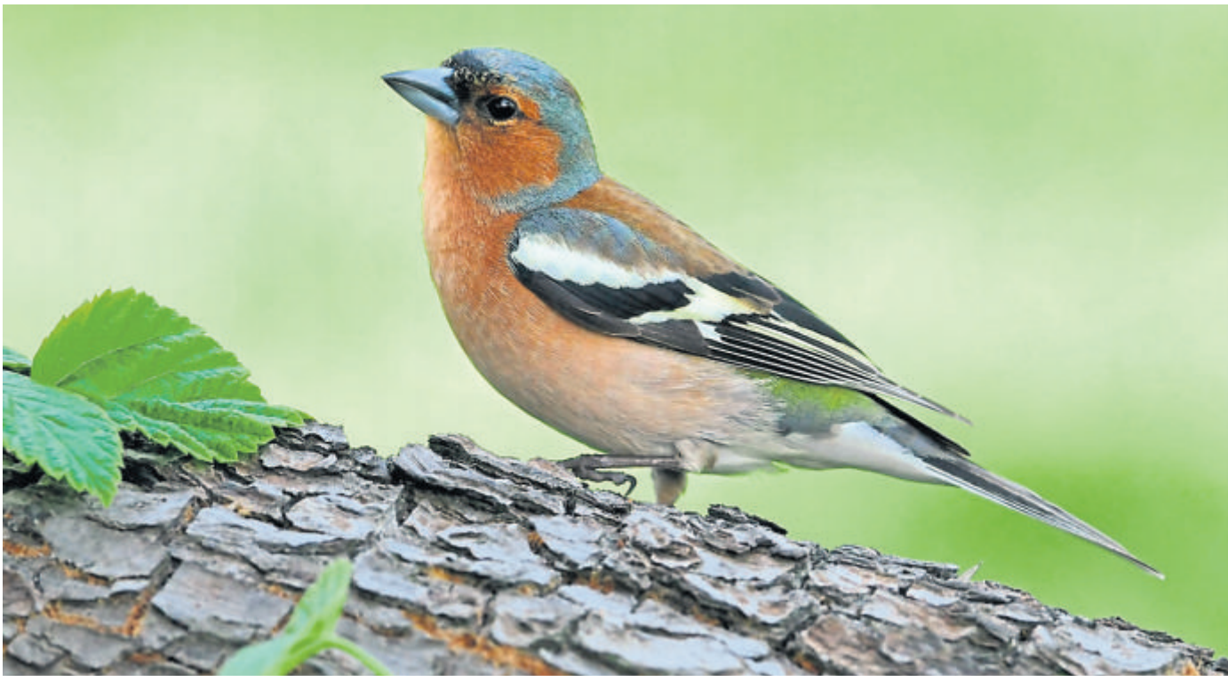
Bei den Buchfinken konnte in Hessen ein Plus bei den Sichtungen von 10 Prozent im Vergleich zum Vorjahr verbucht werden und, der Grünfink machte immerhin ein Prozent Plus.

Zudem findet „Walk & Talk“ jeweils dienstags um 10 Uhr in Dasbach (Brunnen) sowie um 11 Uhr in Niederseelbach am Gemeindehaus statt.