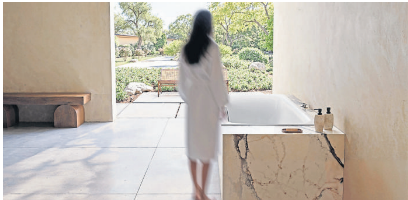
Das Bad wird zum persönlichen Spa: Ein entspannendes Wannenbad, das einen in wohlige Wärme und angenehme Klänge hüllt, lässt zu mehr Achtsamkeit und innerer Ruhe finden.

So verwandeln innovative Hightech-Features das funktionale Badezimmer in eine luxuriöse Zen-Lounge