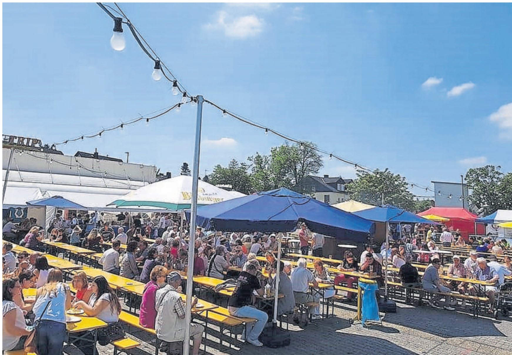
Der Wehener Markt verbindet Tradition, Livemusik und kulinarische Vielfalt.

Wehener Markt lädt für den 3. Juni zum Bummeln, Genießen und Feiern ein