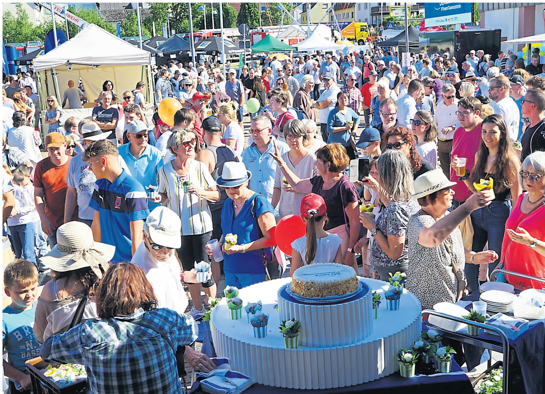
Örtliche Vereine und Initiativen betreiben zahlreiche Stadtteilstände und sorgen auch für das kulinarische Angebot.

Generationenübergreifendes Bürgerfest steigt am 27. und 28. Juni in Bleidenstadt