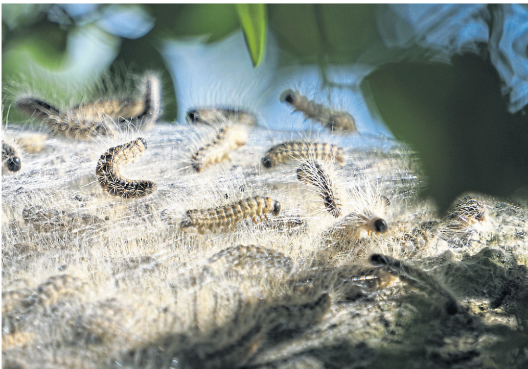
Die Larven der Gespinstmotte sehen dem Eichenprozessionsspinner zum Verwechseln ähnlich.

Der Eichenprozessionsspinner tritt fast ausschließlich an Eichen auf und kann für Menschen und Tiere problematisch sein. Seine Raupen sind mit feinen Brennhaaren ausgestattet, die bei Kontakt Hautreizungen, allergische Reaktionen oder Atemwegsbeschwerden auslösen können. Typisch ist zudem das sogenannte Prozessionsverhalten: Die Raupen bewegen sich in langen Reihen hintereinander am Baumstamm oder auch auf dem Boden. Wer einen Befall vermutet, sollte unbedingt Abstand halten. Weder die Tiere noch ihre Nester sollten berührt oder eigenständig entfernt werden. Aus Gründen des Gesundheitsschutzes ist hier der Einsatz spezialisierter Fachfir-