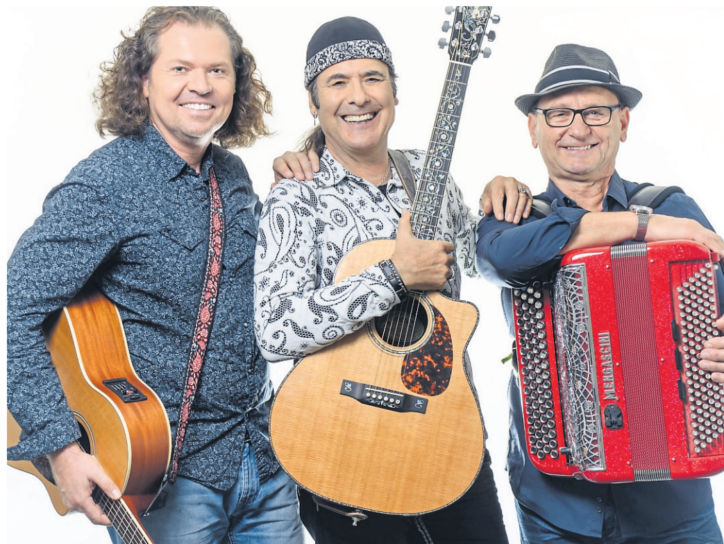
Das Trio blickt auf eine langjährige Bühnenerfahrung zurück und verbindet musikalische Darbietung mit erzählerischen Elementen.

Konzertabend am 21. Juni in der Historischen Caféhalle in Schlangenbad