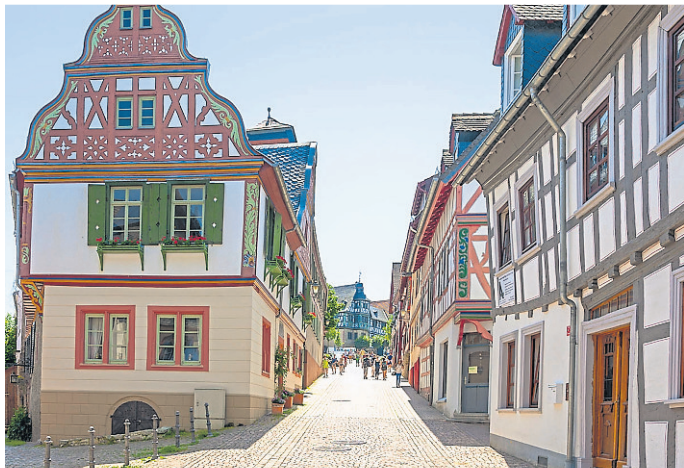
Die Obergasse in Idstein

Für Rückfragen oder Reservierungen steht die Tourist-Info telefonisch unter 06126-78620 sowie per E-Mail an tourist-info@idstein.de zur Verfügung.