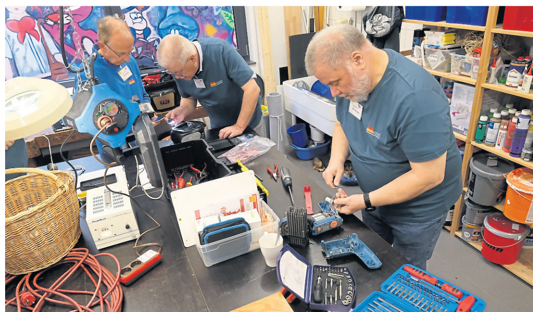
Im Taunussteiner Repair Café im Jugendzentrum Koop hauchen die Ehrenamtlichen kaputten Gegenständen ein zweites Leben ein.

Repair-Café Taunusstein öffnet vor der Sommerpause noch einmal seine Türen