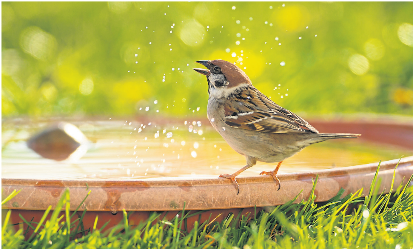
Auch Vögel können bei diesen heißen Temperaturen eine Abkühlung vertragen.

Gerade in den Sommermonaten sind Wasserstellen nicht nur lebenswichtig, sondern auch ein häufiger Treffpunkt im Garten. Viele Vögel nutzen sie nicht nur zum Trinken, sondern auch zum Baden. Das sorgt nicht nur für Abkühlung, sondern hilft auch bei der Gefiederpflege. Für Beob-