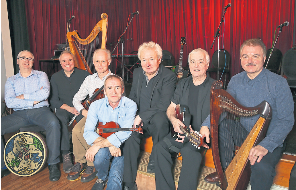
Treffen am 30. Juni im Salon-Theater in Hambach auf: Die Musiker der walisischen Band Ar Log.