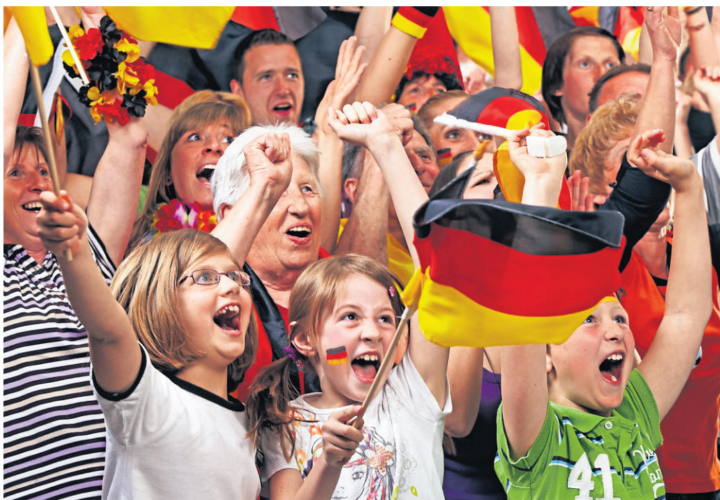
Bei einer WM-Party mit Musik wird das Spiel Deutschland gegen Elfenbeinküste als Public Viewing auf dem Sportgelände des TSV übertragen.

Der Samstag, 20. Juni, steht zunächst im Zeichen des inklusiven Sports. Von 10 bis 16 Uhr wird auf dem Sportplatz die Hessische Meisterschaft im Inklusionsfußball ausgetragen, an der acht Mannschaften teilnehmen. Die Sie-