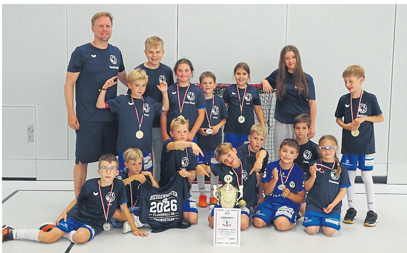
Das U9-Team beim Finalspieltag am 14. Juni in Frankfurt.